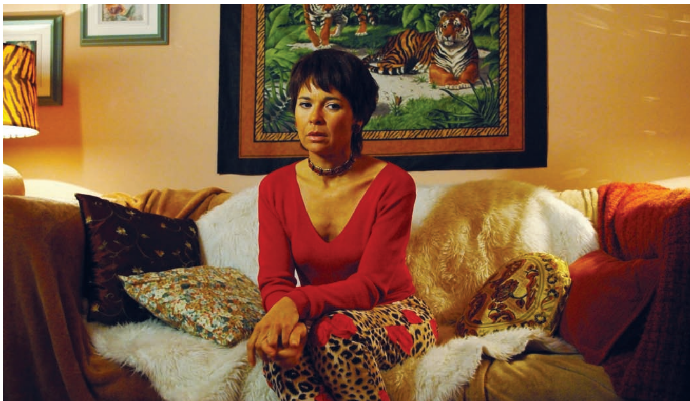
J'ai tué ma mère (2009) de Xavier Dolan