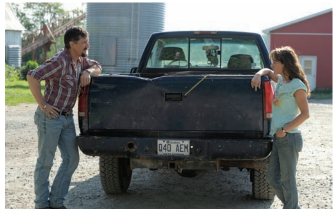
Nuit # 1 (2011) d'Anne Émond et Marécages (2011) de Guy Édoin