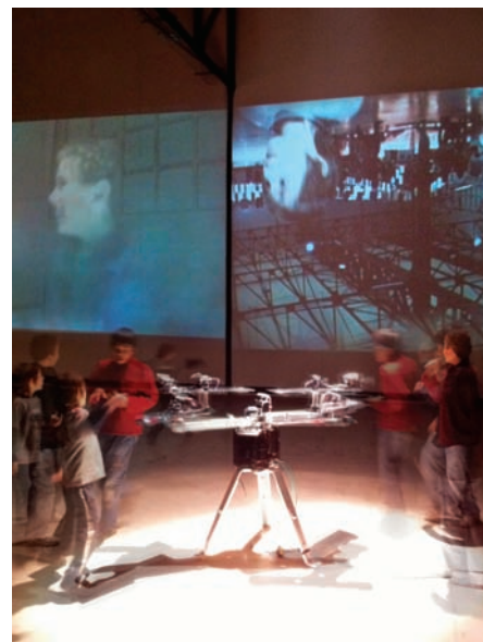
Le cosmos dans lequel nous sommes (2010) de Pascal Dufaux