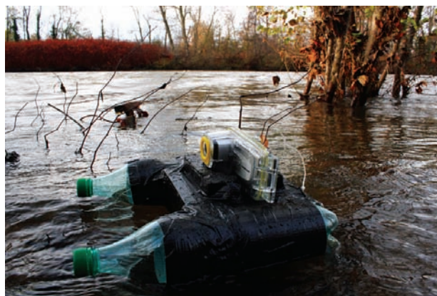
L'œil de la rivière (2009) de Michel Coste

vidéo-cinétique qui fait évoluer deux caméras d'observation (ou de surveillance) en circuits fermés selon de lentes révolutions hypocycloïdales. Les images sont projetées en temps réel sur deux immenses écrans juxtaposés. « Je tente ainsi de renouveler la perception que nous nous faisons de nous-mêmes, des autres et du milieu qui nous entoure, d'en révéler l'étrangeté, la pro-