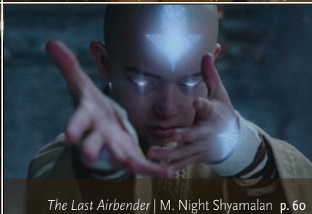
The Last Airbender | M. Night Shyamalan p. 60