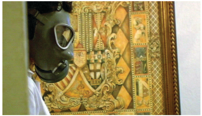
Canary (2009) d'Alejandro Adams

Même s'il récupère également une icône du cinéma de genre, The Clone Returns Home du Japonais Kanji Nakajima se situe néanmoins à l'antipode du projet de Bong, se rapprochant plutôt de celui de von Trier. Le réalisateur se tourne ici vers la science-fiction pour proposer une réflexion philosophique sur la fragilité de la nature humaine. Parce que la figure du clone est tourmentée par des souvenirs qui ne sont pas les siens, elle permet au cinéaste d'interroger ce qui constitue une identité individuelle dans la mesure où, dès notre naissance, une appartenance à un passé sociohistorique nous est imposée, à un point tel qu'elle devient indissociable de notre psyché. La longue errance du protagoniste, qui constitue la trame prin-