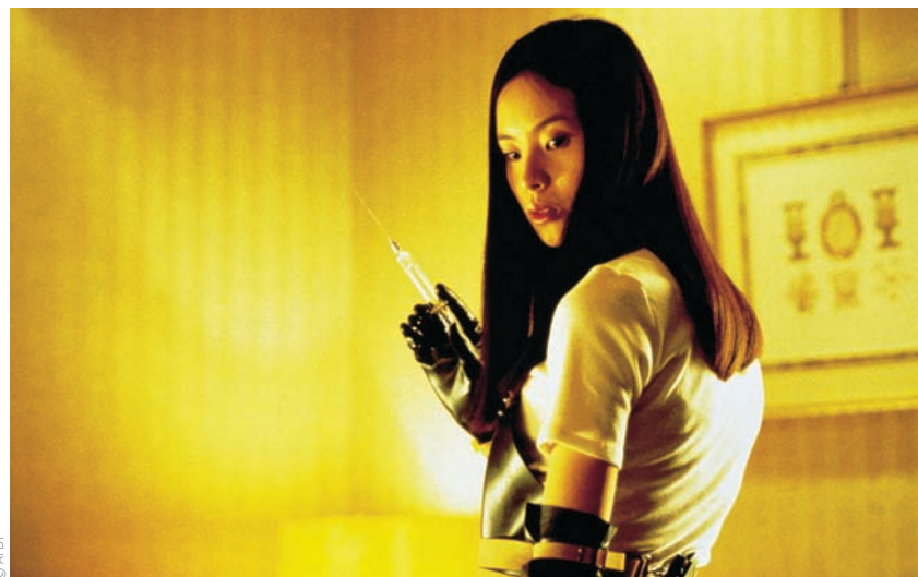
Audition (1999) de Takashi Miike

portrait réaliste d'une famille en détresse et n'hésite pas à critiquer la politique de son pays, il demeure d'abord et avant tout un film de monstres, celui-ci trônant au centre de l'œuvre, en digne meneur de l'action. Dans sa première scène où un scientifique américain ordonne que des déchets chimiques soient jetés dans la rivière Han à Séoul, le réalisateur laisse planer l'ombre de Godzilla, se réclamant fièrement d'une tradition de films qui ne sont pas reconnus pour leur originalité. Avec sa prémisse familière – une créature monstrueuse garde une jeune fille prisonnière, poussant la famille de l'enfant à aller à sa recherche –, et malgré un dénouement inat-