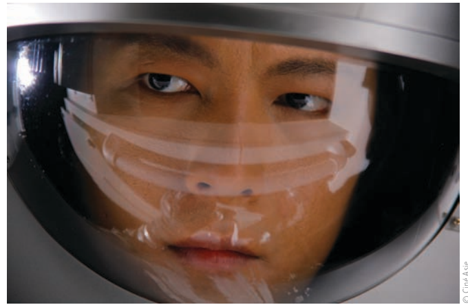
Clone Returns Home (2008) de Kanji Nakajima

Ces trois films témoignent de l'intérêt que plusieurs cinéastes internationaux portent aux genres depuis une quinzaine d'années. En effet, si les exemples cités sont contemporains, il aurait été possible de remonter quelque peu dans le temps et d'évoquer, entre autres, la relecture du mythe du vampire qu'est Habit (1997) de Larry Fessenden, Audition (1999) de Miike ainsi que le lovecraftien Maléfique (2003) d'Éric Valette. Qualifier la présente vague de cinéastes de « génération Fantasia » donnerait trop de crédit à la manifestation, même si le festival demeure une plateforme idéale pour la diffusion de ce cinéma. Sans le recul nécessaire du temps