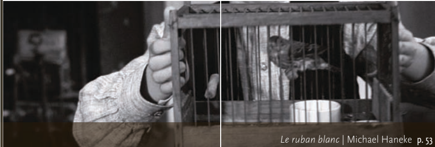
Le ruban blanc | Michael Haneke p. 53