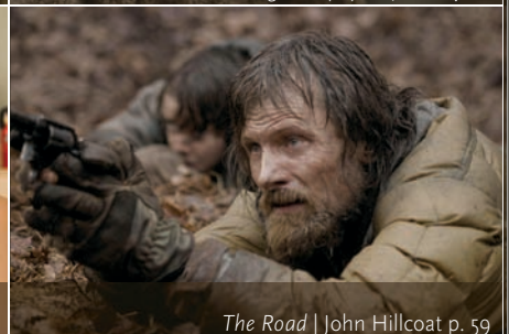
The Road | John Hillcoat p. 59