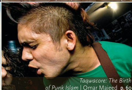
Taqwacore: The Birth of Punk Islam | Omar Majeed p. 60