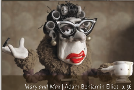
Mary and Max | Adam Benjamin Elliot p. 56