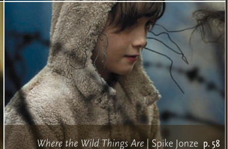
Where the Wild Things Are | Spike Jonze p. 58