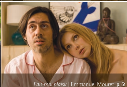
Fais-moi plaisir | Emmanuel Mouret p. 61