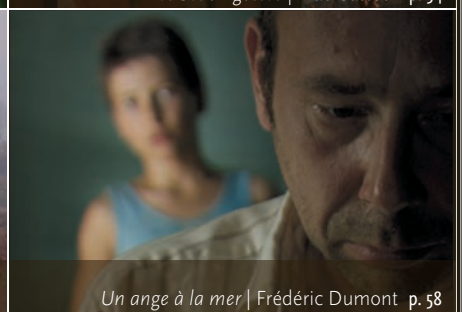
Un ange à la mer | Frédéric Dumont p. 58