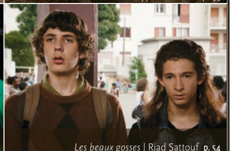
Les beaux gosses | Riad Sattouf p. 54