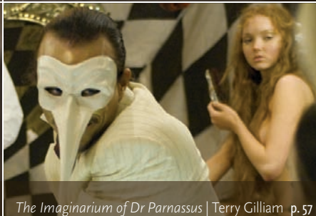
The Imaginarium of Dr Parnassus | Terry Gilliam p. 57