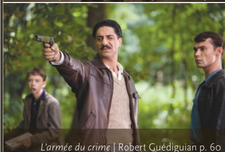
L'armée du crime | Robert Guédiguian p. 60