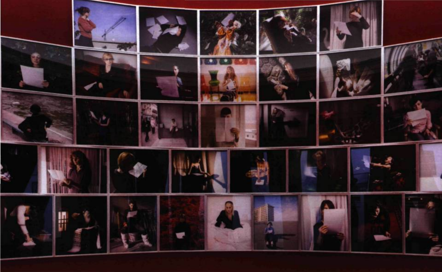
Exposition Prenez soin de vous de Sophie Calle, présentée à Montréal en 2008 à la galerie DHC/ART Fondation pour l'art contemporain