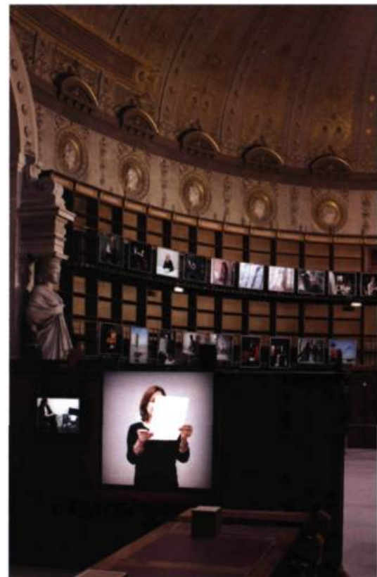
Exposition Prenez soin de vous de Sophie Calle (2008) à la Bibliothèque nationale de France à Paris

Mais qu'est-ce qui accentue dans l'installation de ces images mouvantes exposées, cet effet de présentation plutôt que de représentation ?