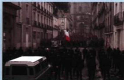
Scènes d'affrontement dans Lady Oscar et Une chambre en ville

médicinales pour endiguer la propagation de la peste. Les péripéties de Lady Oscar s'inscrivent dans une France qui s'appête à vivre sa Révolution. Les fidèles Jacqueline Moreau pour les costumes et Bernard Evein au décor s'en sont donnés à cœur joie. Si Demy est sans doute moins à l'aise dans les scènes de bagarres collectives, il tresse l'intrigue d'une variation