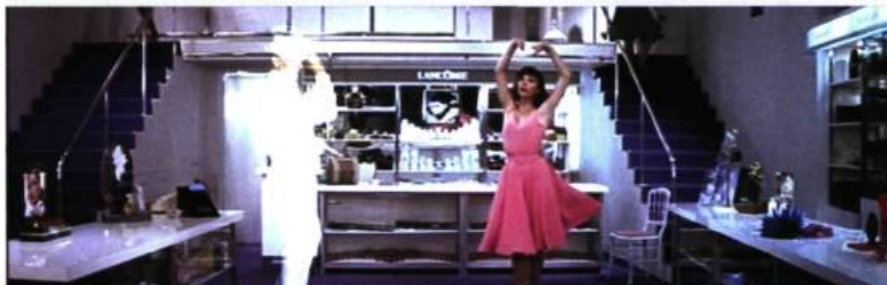
Trois places pour le 26

Faut-il lire ce kaléidoscope de couleurs comme un art d'accommoder les douleurs ? C'est plutôt un mouvement commun qui emporte le tout et fait la beauté particulière des plus belles réussites de Demy. Peintre, le cinéaste est de ceux – cela crève les yeux – qui ont poussé le plus loin l'irréalisme des coloris apposés à des décors souvent naturels. Mais le plus frappant est sans doute la sidération chromatique du blanc, contrepoint récurrent auquel on ne peut assigner un sens prédéterminé si ce n'est celui parfois d'une apparition inattendue. Voitures américaines de rêve, blondeur irréelle ( La baie des anges ), robes ou costumes immaculés, spectre ( Trois places pour le 26 ), le blanc est aussi celui de la toile que le galeriste conceptuel des Demoiselles de Rochefort souille de giclées de couleurs et à coups de pistolet. Il est vrai que ce dernier est un tueur de rêves.