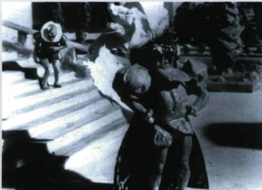
Barbe-bleue de Jean Painlevé et René Bertrand