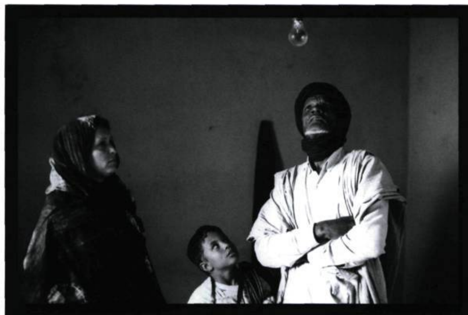
Heremakono - En attendant le bonheur

24 images : Du fait de ce déficit d'images et de mémoire, on vient donc au thème de Bamako qui montre la société civile africaine faisant le procès des institutions financières internationales. La catharsis passe ici par la parole. Le film commence avec ce personnage qui veut faire sortir les mots pour ne pas étouffer. Il faut donc dire et nommer les choses, dire le drame et la dignité de l'Afrique. Il y a là une perte et une souffrance incommensurables.