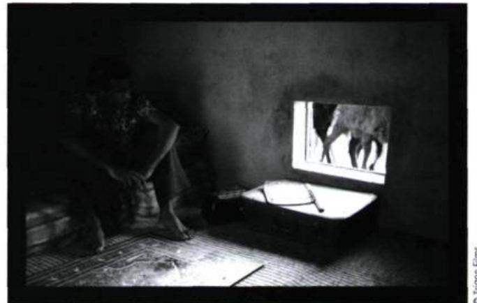
Heremakono - En attendant le bonheur

A.S. : Une caméra, c'est une plume, un instrument qui permet à quelqu'un de s'exprimer. Lorsqu'un instrument se démocratise, ça veut dire que plus de gens ont accès aux outils et peuvent s'exprimer. Dans ce sens-là, c'est une bonne chose. De plus en plus de jeunes font du documentaire en Afrique grâce au numérique. C'est important parce que le documentaire permet à quelqu'un d'affronter sa réalité, sans se cacher, sans détour. Aujourd'hui, il y a une nouvelle génération de cinéastes qui tourne plus facilement. Il reste que, au risque de simplifier, le numérique n'a pas enrichi les cinémas américain ou européen. Pour l'instant, il n'a pas vraiment produit des gens plus talentueux. C'est comme pour la pellicule film... le numérique ne fait pas le talent. Mais, bien sûr, le fait pour un artiste de ne pas être obligé d'attendre les subventions gouvernementales pour tourner, ça permet d'aller plus