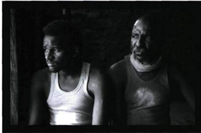
Daratt , de Mahamat Saleh Haroun, film produit par Sissako

mentaire ou de la fiction. La vie sur terre m'a beaucoup aidé pour la suite des choses. À l'époque, les gens m'ont fait confiance et c'est tout à l'honneur de la chaîne de télévision Arte, qui m'a permis de tourner avec un synopsis de trois pages. Bamako , c'était différent. Même s'il n'y avait pas de scénario classique de cent vingt pages, il y avait quand même un « traitement » d'une quarantaine de pages.