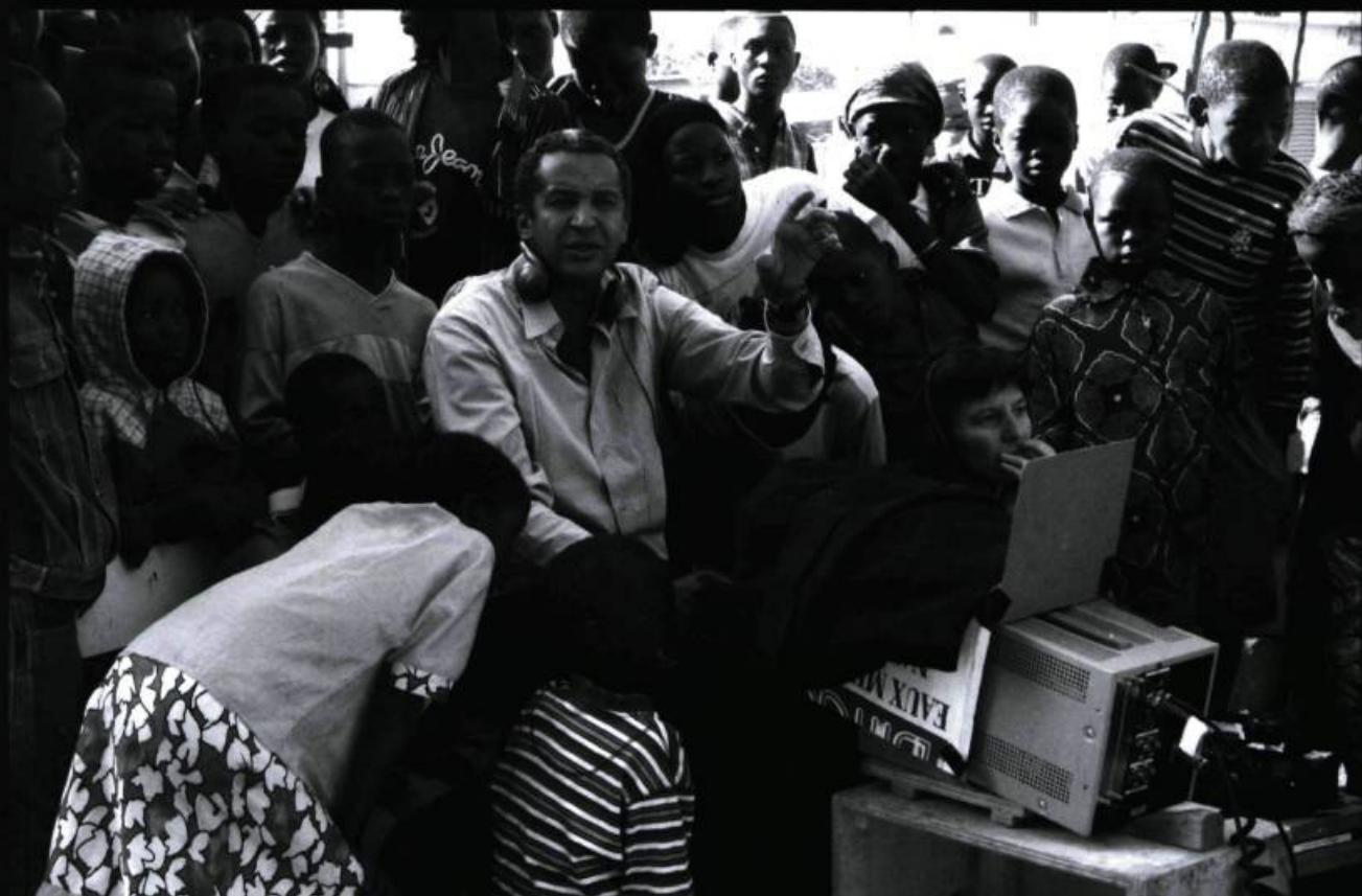
Sissako sur le plateau de Bamako

Né à Kiffa en Mauritanie, Abderrahmane Sissako passe son enfance au Mali. En 1983, il part pour Moscou afin d'étudier au célèbre VGIK, l'Institut national de cinématographie. Il y réalise deux courts métrages Le jeu et Octobre qui est présenté à Cannes en 1993. Suivent deux autres courts métrages : Le chameau et les bâtons et Le carré de l'échiquier . En 1998 nous parvient le magnifique La vie sur terre , tourné pour la chaîne Arte dans le cadre de la série « 2000 vu par... » En 2003, En attendant le bonheur remporte, entre autres prix, la Louve d'or au Festival du nouveau cinéma de Montréal. Bamako , son plus récent film, a ouvert ici dernièrement le Festival sur les droits de la personne. Tourné en cinq semaines pour un budget de 1 500 000 $US, Bamako embrasse admirablement le particulier et le général à l'heure de la mondialisation. Rencontre avec un cinéaste épris de justice, qui rêve d'harmonie pour l'Afrique et le monde.