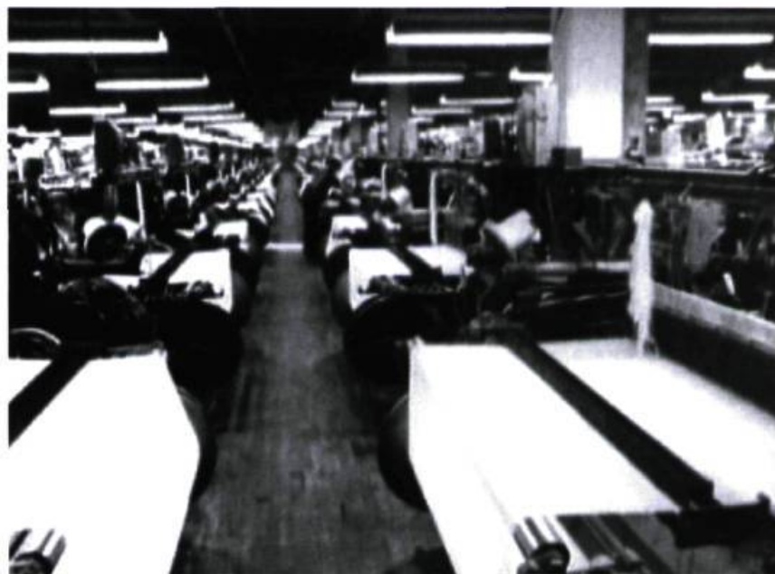
On est au coton (1970) de Denys Arcand

Par ailleurs, le problème causé par tous ces dépôts et donations, c'est que nous n'avons pas le personnel nécessaire pour traiter et vérifier l'état de tout ce matériel, s'il a été bien conservé, si les couleurs n'ont pas viré. Le noir et blanc pose moins de difficultés que la couleur, qui demande un entreposage dans des conditions parfaites de température et d'humidité contrôlées. Par exemple, dans le cas de copies de diffusion 16 mm, tirées dans les années 1980-1990 et destinées à une diffusion immédiate, leur durée de conservation n'était pas prise en considération; après cinq ans, les couleurs changent rapidement si les copies ne sont pas bien entreposées. C'est tout ce travail d'évaluation des copies que nous n'arrivons pas à faire actuellement.