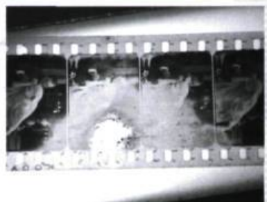
Vérification d'un dépôt de matériel non identifié sur support nitrate