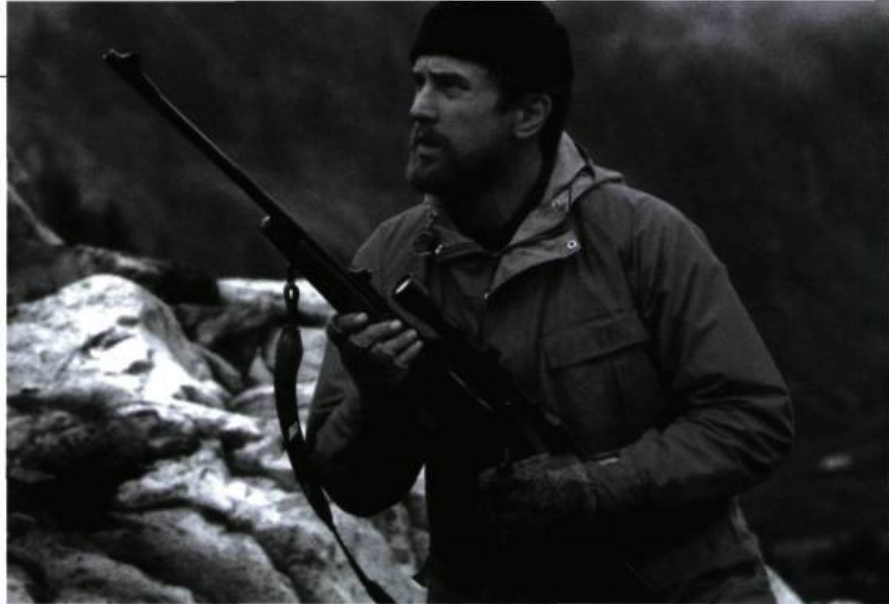
The Deer Hunter (1978).

de ce film que de laisser vivre ses personnages sans jamais y superposer le moindre discours sociologique. Cimino ne les juge pas, mais filme avec tendresse et objectivité ce qu'il nous revient ensuite d'apprécier : tout l'inverse de cette maladie cinématographique contemporaine, dont les racines sont vieilles de trente ans, qui consiste de la part du metteur en scène à se donner une contenance politique aux dépens de ses personnages (cf. les films d'Altman ou le nouveau Wenders).