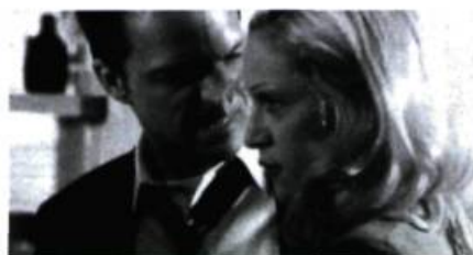
Dangerous Game (1993).