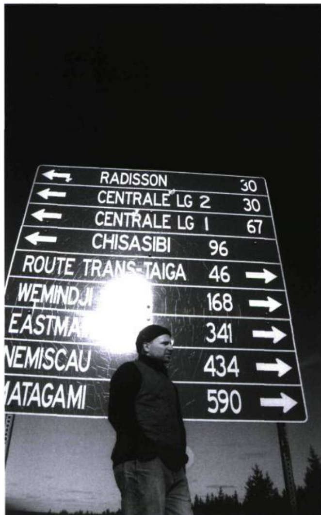
Les états nordiques de Denis Côté.

D.C. : Non, j'ai un cameraman pour l'image. Il a tourné avec une DVX 100A Panasonic, 24 P.