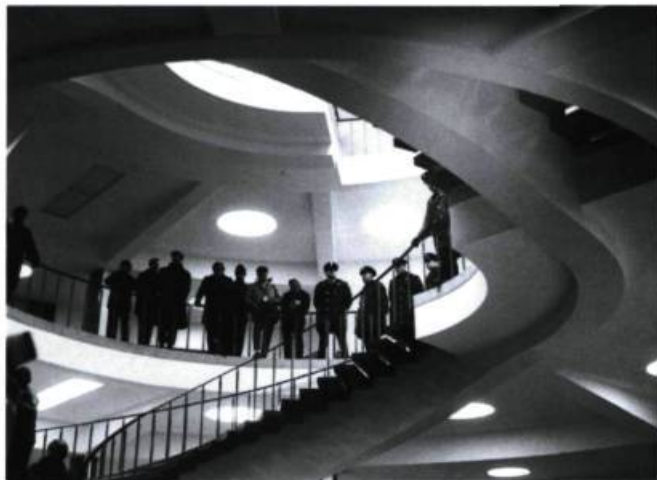
L'Acadie l'Acadie ?! de Michel Brault et Pierre Perrault.

chemins ont été arpentés. Moi, qu'est-ce que je fais aujourd'hui? Pour filmer, je commence avec un problème, celui de la nouveauté. Ça fait dix ans que j'y suis confronté, pas tellement sur le plan technique que sur celui du contenu. Je ne suis pas technicien, et je n'ai jamais su faire du montage. Ça ne m'intéresse pas. Sur le plateau, je m'entoure de gens qui peuvent m'aider à réaliser ce que je veux. Mais, j'affronte le défi de la nouveauté, par un mélange de fiction et de documentaire par exemple, qui n'est peut-être qu'une mode mais qui offre encore des possibilités à explorer. Dans mon film, ce que j'ai voulu, ce n'est pas de raconter une histoire de A à Z, mais de marier la fiction et le documentaire.