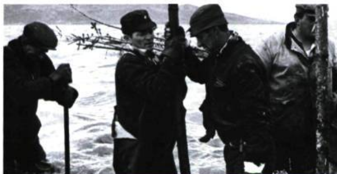
Pour la suite du monde de Michel Brault et Pierre Perrault.