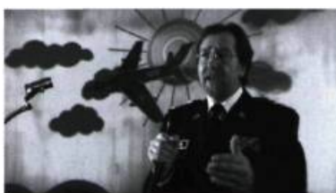
Made In Estonia de Rando Pettai.

Les investissements massifs dans ces nouveaux établissements proviennent pour l'essentiel de sociétés étrangères. Il est évidemment illusoire de croire que la programmation de ces salles pourrait différer en fonction de l'origine des capitaux... Seul Budapest Film, financé par la municipalité de Budapest, l'infléchit vers un cinéma moins américanisé. Mais ces ouvertures de multiplexes ne permettent pas, néanmoins, de relancer de manière importante la fréquentation (les 59 millions de spectateurs représentent à peine un tiers des entrées totales en France) et l'amortissement de ces lieux coûteux devient parfois problématique. Parallèlement à ces nouvelles salles, le réseau européen de salles de cinéma (Europa Cinemas, financé par le programme Media, Eurimages, le Centre national du cinéma français et le ministère des Suite page 34 >