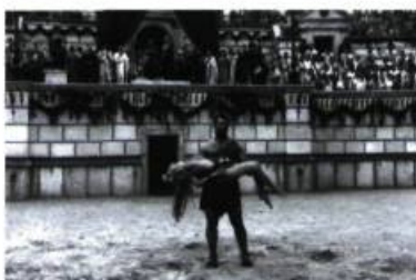
Quo vadis? de Jerzy Kawalerowicz.