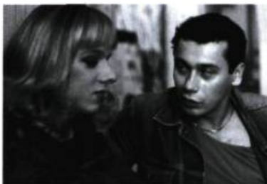
Pupendo de Jan Hrebek.