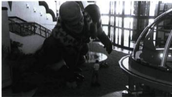
Superhéros gonflable, symbole de la « machine à tuer » du cinéma populaire américain. Les photos des pages 11 à 20 sont tirées du film À l'ombre d'Hollywood de Sylvie Groulx.

Vision réductrice et alarmiste que tout cela ? Sans doute. L'humanité n'en est pas après tout à sa première mondialisation. L'art