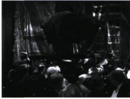
Le temps des bouffons (1993).