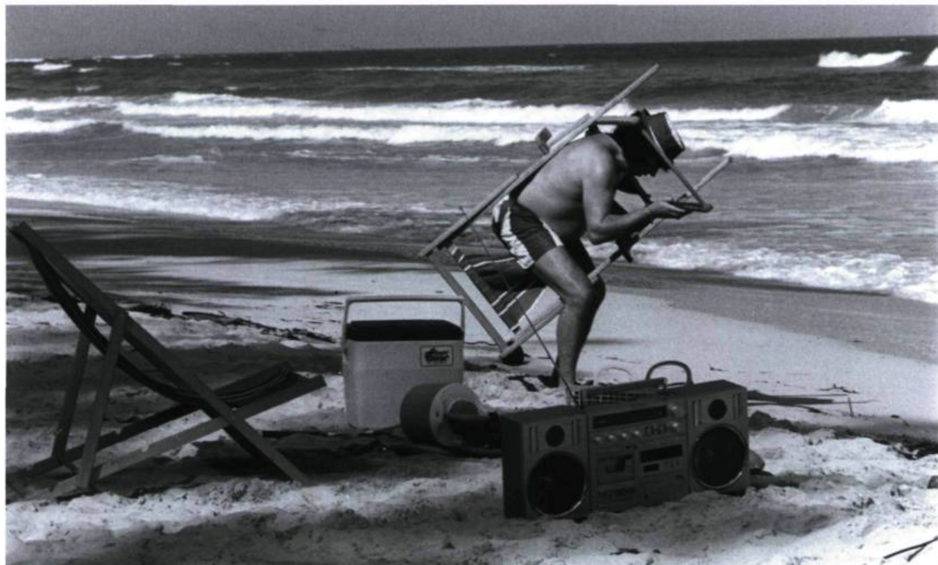
Les vacances d'Elvis Gratton (1983).

et je lui ai demandé de passer à son émission, en lui expliquant pourquoi. Elle ne connaissait pas Theodorakis, mais elle m'a dit «O.K., viens.» Après le spectacle, des gens sont venus me voir, et parmi eux du monde bien ordinaire, pour me dire : «Monsieur Falardeau, merci beaucoup!» Moi, j'accepte d'aller à la télé pour ça... Une autre fois encore le recherchiste de la même émission m'appelle pour que je vienne parler de mes «lectures d'été». Alors je commence à lui énumérer mes titres : Géopolitique et avenir du Québec , Écrits corsaires de Pasolini... Il sursaute : «Oui mais, c'est une émission d'été! – Tu me demandes mes choix et c'est ça que je lis, été ou pas, alors si ça ne fait pas ton affaire, appelle quelqu'un d'autre.» Eh bien, à Julie Snyder, j'ai parlé de ces livres-là. Par moments, j'étais peut-être à mille milles au-dessus de la tête du monde, mais personne ne parle nulle part de livres comme ceux-là et si j'ai pu retenir l'attention ne serait-ce que de quatre personnes, ce n'est pas perdu... 21