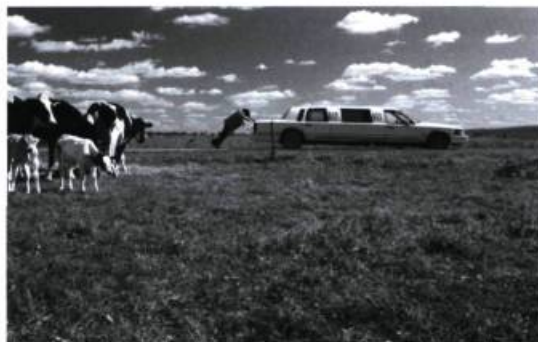
Elvis Gratton XXX : La vengeance d'Elvis Wong.

À peu près un an après la sortie d' Octobre , Julie Snyder m'invite à passer à son émission pour parler du film. Quand la recherchiste m'appelle, je lui dis que j'accepte à condition qu'on ne me fasse pas faire de niaiseries, la prévenant que si Julie Snyder était tarte, j'al-