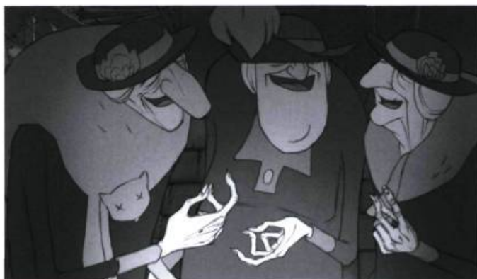
Les triplettes de Belleville.

B ien que réalisé par un Français, Les triplettes de Belleville est une coproduction internationale ayant à son générique des Français, des Belges, des Québécois et des Lettons qui ne se sont jamais rencontrés pendant sa fabrication. Le film de Sylvain Chomet, échevelé et rock and roll , s'adresse aux adolescents et aux adultes. L'introduction, qui pastiche un film ancien en noir et blanc et rayé, fait référence aux cartoons musicaux des frères Fleischer et au mouvement particulier que ceux-ci ont mis au point, mouvement composé de cycles très brefs qui donne aux personnages l'allure d'être faits de caoutchouc. S'affirmant ainsi comme un cinéphile cultivé, Chomet s'amuse par la suite à jouer la carte du second degré, empruntant aussi bien aux comédies de Tati (surtout Jour de fête ) qu'aux films de gangsters hollywoodiens. Le film affiche alors la facture du bric-à-brac, de l'hétéroclite, de l'impureté, ce qui se justifie dans la mesure où l'histoire raconte la rencontre impossible de deux cultures ultra-stéréotypées qui, par essence, ne peuvent que s'exclure. Cette caractéristique constitue sûrement ce que Les triplettes de Belleville a de plus jouissif — on y entre comme dans une sorte de caverne d'Ali Baba. Elle explique aussi qu'on garde davantage