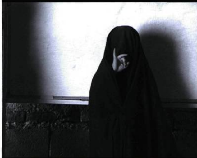
L'alphabet afghan de Moshen Makhmalbaf.