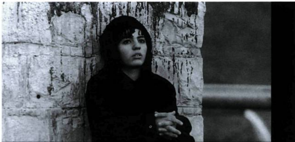
Bemani de Dariush Mehrjui. Destins croisés de jeunes filles iraniennes.

mes en tant que personnages à part entière tendent à occuper l'espace public avec de plus en plus de détermination 1 . Après l'audacieux Le cercle de Jafar Panahi, l'allégorique et poétique The Day I Became a Woman de Marziyeh Meshkini, l'émancipateur La pomme de Samira Makh-