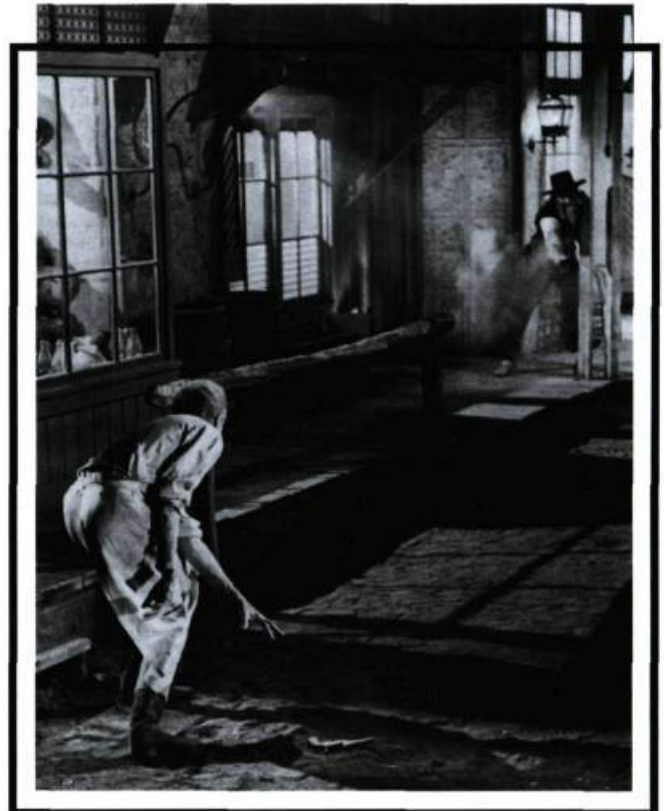
The Man Who Shot Liberty Valance de John Ford.

C'est vrai que l'espace fait partie de la syntaxe du western, mais il n'y a pas que l'espace pour rendre les westerns séduisants. The Man Who Shot Liberty Valance se déroule presque entièrement en intérieurs et certains longs moments sont mis en scène avec un