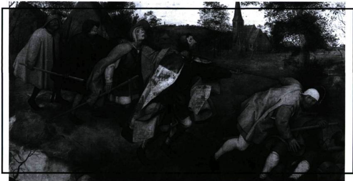
La parabole des aveugles, Pieter Bruegel l'Ancien, 1568.

U ne de nos animatrices de radio parle régulièrement de cinéma, se vantant chaque fois de ne pas avoir vu les films. Elle l'affirme sans arrogance mais avec un brin de coquetterie. Le réalisateur lui raconte l'histoire ou quelqu'un de sa famille. Cet ersatz lui suffit. Chaque soir, l'indicatif égrène les sons en cascade de Keith Jarrett entendus dans le Journal intime de Moretti. (N'a-t-elle pas eu la curiosité d'aller y jeter un œil? Dommage!) Sans compter que le titre de son émission est emprunté à Bergman. (Cela m'étonnerait quand même qu'elle n'ait pas pénétré dans le gynécée rougeoyant de Cris et chuchotements .) Sait-elle que ce réalisateur a aussi signé Le silence ? Référence à proscrire pour qui doit placoter, j'en conviens. D'ailleurs l'animatrice sait se taire, elle ne palabre pas. Pas trop. Parce qu'on en reconnaît le timbre et la prosodie, elle a ce qu'on appelle une voix. Pour ma part, je trouve agaçant qu'elle malmène à ce point les accents toniques, restituant les mots en un ruban chantonnant et grêlé. Mais, faute d'avoir trouvé le modèle qui l'a inspirée, je lui accorde le mérite d'avoir créé cette voix qui est tout sauf sotté. Notre commère a souvent de l'esprit. Un soir d'hiver, elle présente la pièce musicale finale du Goût des autres . Les notes de Non, rien de rien qui se détachent en staccato de la fanfare télé-