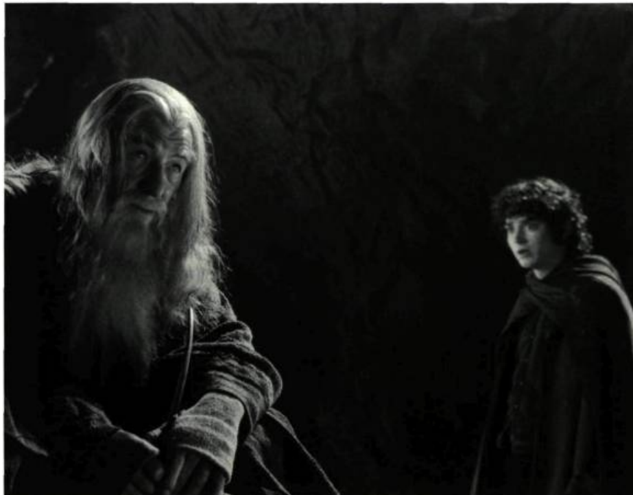
Ian McKellen et Elijah Wood.

effet d'un film habité d'un certain souffle épique, qui se distingue par sa clarté et son efficacité narratives.