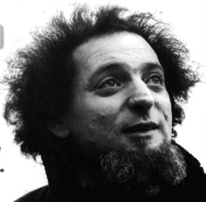
Georges Perec en 1975.