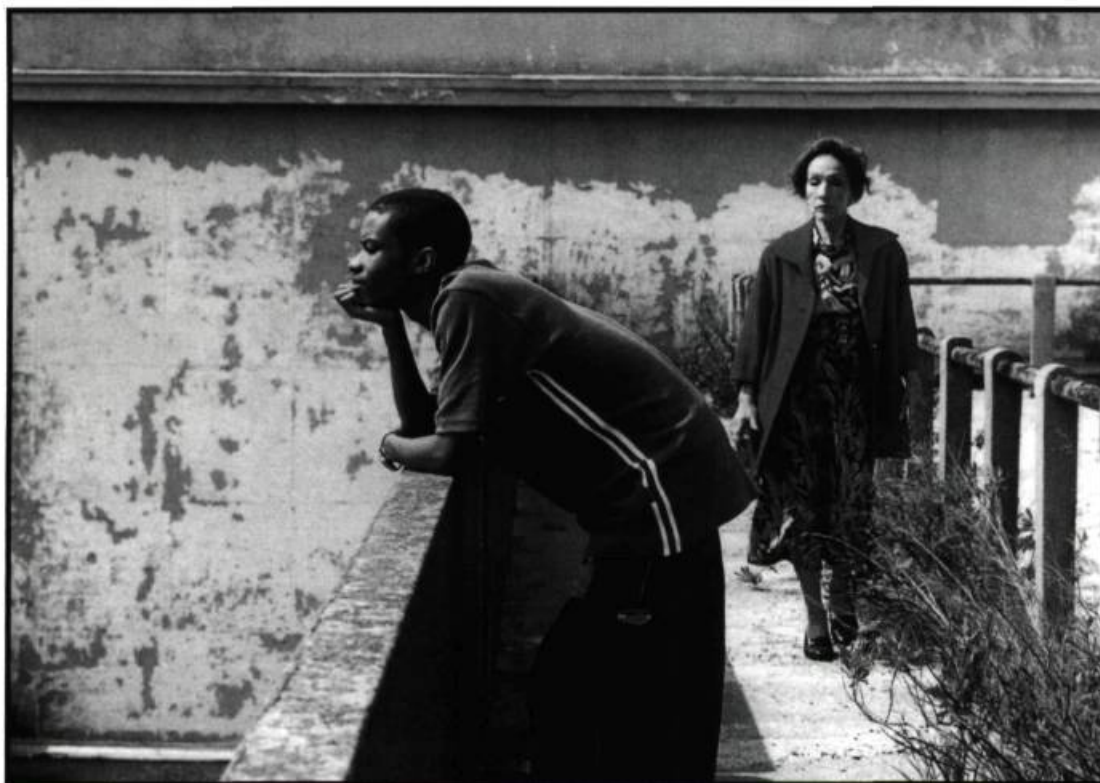
Habité par un devoir de mémoire, Un costume trois pièces d'Inês de Medeiros révèle une cinéaste talentueuse.

tante, qui touche les exclus et les sans-voix de la société portugaise (et, au premier chef, les immigrants du Cap-Vert et d'ailleurs) appelle chez Costa «un cinéma de la vengeance» qui, comme chez Chaplin ou Rossellini, «venge des massacres sans tuer personne, sans faire violence, sans violer» 6 . Comme si, dans sa quête d'une forme pure et originelle, le cinéma pouvait utiliser tout le potentiel de sa «machine à tuer les méchants» pour imposer le triomphe de la vie par la vérité et la transparence du regard. Si on considère qu'il y a eu longtemps un véritable divorce entre le cinéma portugais et son public qui refusait la confrontation avec le réel, nul doute que le cinéma radical de Pedro Costa, qui rend compte «du poids de mort» et «du caractère presque funèbre» de la culture de son pays, marque profondément les esprits.