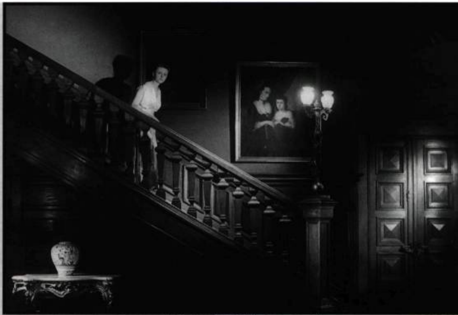
Temps difficiles (1988) de João Botelho.

des différentes générations de cinéastes, et révéler ainsi la maturité prolifique d'une cinématographie qui semble aujourd'hui résolument campée dans la modernité. Car au pays de Fernando Pessoa, toutes les générations tournent depuis deux ans et, aux dires de Raquel Freire ( La déchirure ), la plus jeune des cinéastes invités, il y aurait actuelle-