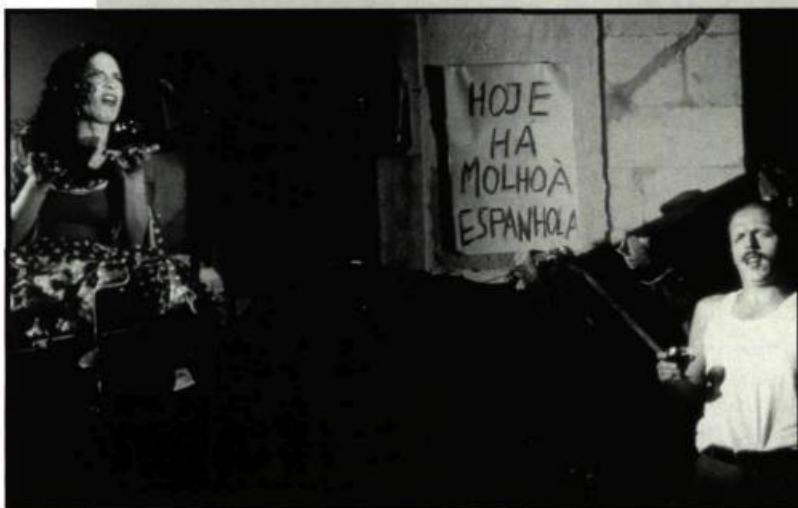
La fenêtre d'Edgar Pêra, une fiction éclatée, à la limite de l'expérimental.

supplément d'âme qui ferait de cette trajectoire de vie une expérience du regard bouleversante, comme pouvait l'être par exemple le visionnement d'un autre film-limite comme Sombre de Philippe Gandrieux.