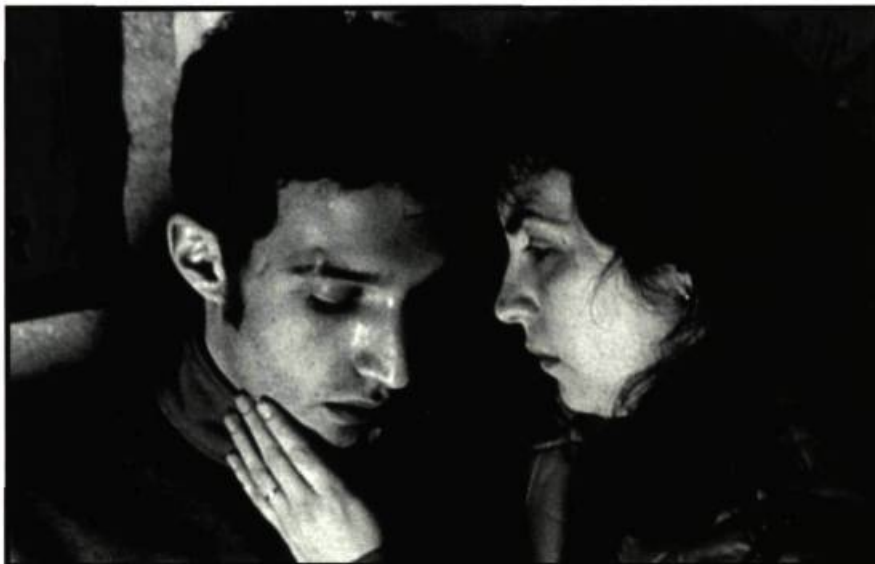
Gagner la vie de João Canijo risque la confrontation avec le réel le plus brut.