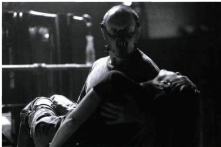
Anthony Hopkins, Julianne Moore.

Le médiocre Ridley Scott (son Gladiator reste affligeant malgré tous les honneurs dont on l'a gratifié) ne pouvait évidemment pas sauver le plat. Il continue plutôt de donner des signes de plus en plus inquiétants de la pathologie qui l'amène à calquer maladroitement Kubrick. Je me contenterai d'un exemple: dans Hannibal , le vrai vilain est un infirme, comme souvent chez Kubrick où les hommes en fauteuil roulant ont toujours été suspects (voir Dr Strangelove et Barry Lyndon ). (É.-U. 2001. Ré.: Ridley Scott. Int.: Anthony Hopkins, Julianne Moore, Gary Oldman, Ray Liotta, Giancarlo Giannini.) 131 min. Dist.: Universal. — M.J.