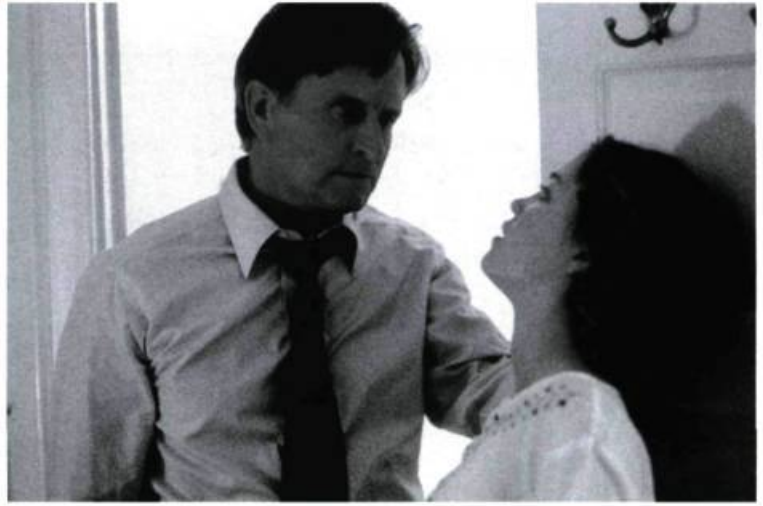
Michael Douglas et Erika Christensen.