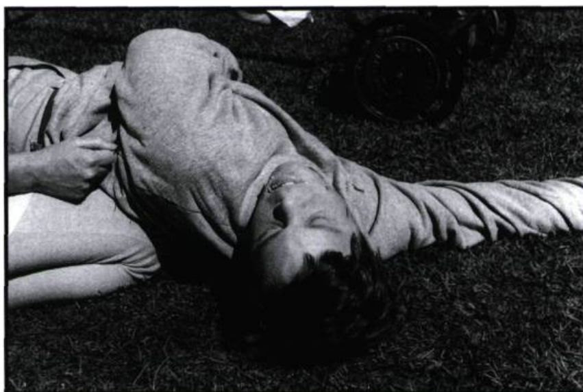
Tristesse modèle réduit.

(1987, 83 minutes). Ou l'aliénation de la vie de banlieue vue à travers le regard d'un garçon trisomique. «Une autre déception... Dans ma tête de naïf, de gars qui à tout le temps fait des vues à 500 ou à 1000 piastres, je me disais: "Avec 750 000 $, je vais me payer la traite!" Je voulais tourner en extérieurs, mais en faisant projeter les paysages ambiants sur des blue screens , pour avoir un effet d'irréel, visualiser le monde imaginaire d'un déficient. Puis un jour, le directeur de production m'a dit: "Où est-ce que tu t'en vas avec ça? Avec le budget que t'as, tu peux à peine te payer cinq acteurs pendant un mois!" Alors, je me suis retrouvé à tourner une vue ben straight qui a été sauvée par le déficient lui-même. À l'arrivée, j'ai été très surpris que ce soit aussi bien reçu.»