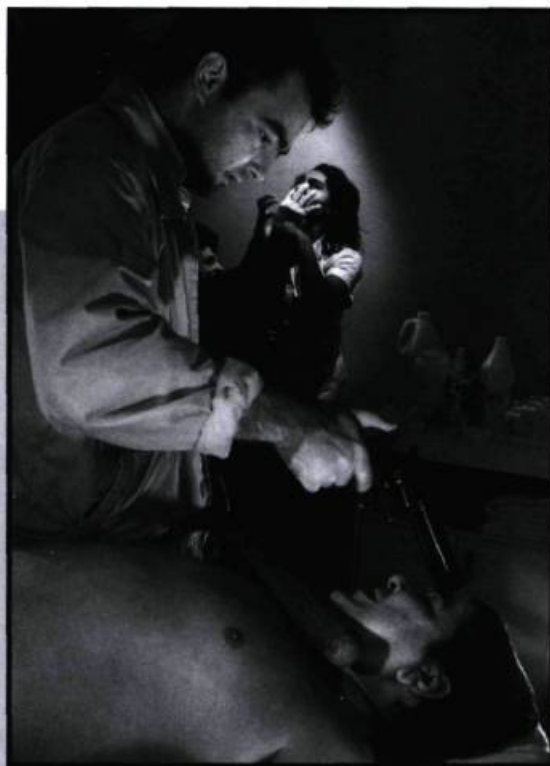
Requiem pour un beau sans-cœur.

(1997, 90 minutes). Dans une piquerie, une descente de police filmée par la télévision tourne au bénéfice des assiégés lorsque ceux-ci prennent en otage un caméraman et deux policiers. «J'ai déjà eu des problèmes de dope assez sérieux. À un moment donné, à la fin de Windigo , j'ai pensé me soulager avec de la grosse drogue. Je ne l'ai pas fait, finalement, et j'ai écrit cette histoire-là à la place. Je voulais faire quelque chose de tellement insupportable que ce serait presque de l'ordre de la sensation physique... Jusque-