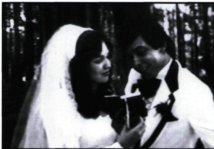
Le royaume est commencé.