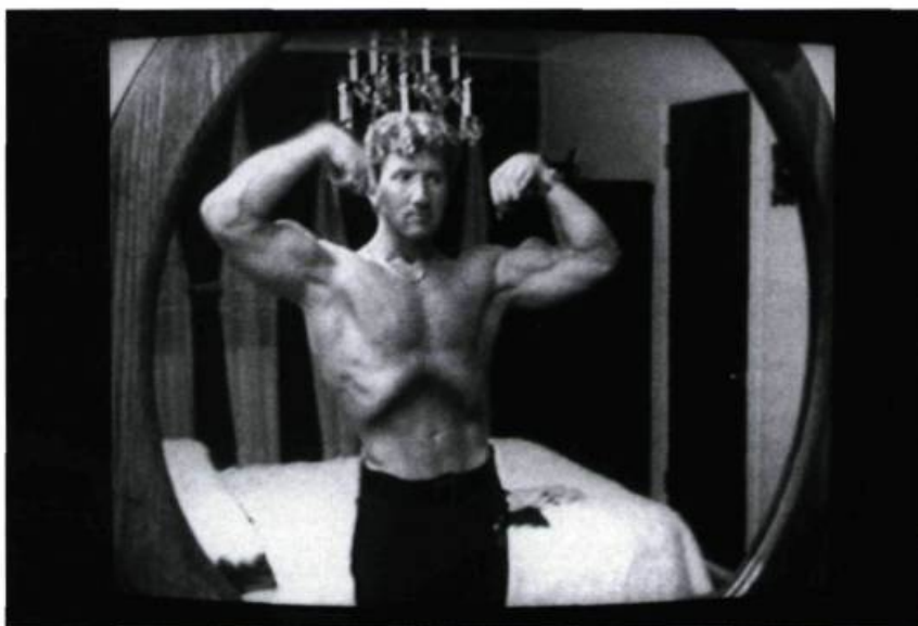
Ma richesse a causé mes privations.

Ma vie, c'est pour le restant de mes jours (1980, 27 minutes). Dans un bar de campagne, un rembourreur tente, sous les yeux de son amie, d'intégrer un numéro de cascadeur au spectacle d'une danseuse nue. Étrange «happening» à mi-chemin entre le psychodrame et l'orgie. «Ça, c'est un accident que j'ai tiré de Il a gagné ses épaulettes . L'Institut québécois du cinéma m'avait donné 5000 $ pour faire une vue sur des gens ordinaires qui font des choses hors de l'ordinaire... Alors, je me suis retrouvé avec ce cascadeur, qu'on a filmé dans un petit hôtel à Saint-Pie-de-Bagot. Et là, ça a dévié et c'est devenu une espèce de descente où j'ai accom-