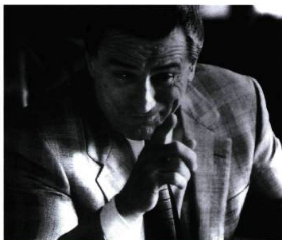
Robert De Niro.

Au fil des ans, Harold Ramis s'est taillé une place de choix dans le paysage de la comédie américaine. En effet, Groundhog Day et Multiplicity ont démontré qu'il pouvait, mieux que quiconque actuellement, jouer avec les structures narratives pour provoquer le rire. Analyze This ,