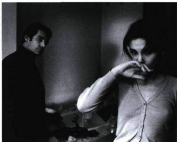
Gérard Lanvin et Virginie Ledoyen.