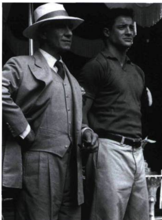
Ian McKellen, Brendan Fraser.

des trois catégories suivantes: «cinéma de vieille fille», «cinéma de chochette» ou «cinéma agace-pissette». (É.-U.-Roy.-Uni 1998. Ré.: Bill Condon. Int.: Ian McKellen, Brendan Fraser, Lynn Redgrave et Lolita Davidovitch.) 105 min. Dist.: Lions Gate. — A.R.