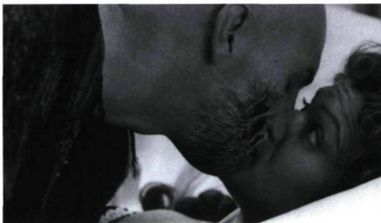
Arnold Vosloo et Rachel Weisz.

Magic, qui effraie non pas par des «Bouh!» mais par des effets spéciaux tonitruants. Sommers ne lésine pas ici sur le spectaculaire grotesque (insectes hideux de toutes sortes, cadavres en décomposition). Il donne à Brendan Fraser le rôle d'un sous-Indiana Jones (sexy, athlétique et désinvolte) qui se balade dans un cadre arabo-touristique (mis en valeur par le Cinemascope). Un critique appliqué essaierait d'expliquer pourquoi ce film est légèrement supérieur à ses équivalents estivaux (par exemple, Godzilla et Independence Day ), et il conclurait peut-être que The Mummy est un peu moins prétentieux et patriotard, mais en vain. Les blockbusters d'été, à force de se répéter, déjouent l'acte critique jusqu'à la lassitude; The Mummy , ça sent et ça goûte le cinéma, mais ça n'en est pas, c'est autre chose. Principe premier: que le spectateur-consommateur en ait pour son argent. On pourrait écrire que le film «n'est que la somme de ses effets», mais ce serait formuler une évidence, car, en fait, ce type de production usinée exige une analyse qui rend compte d'une tendance de fond. (É.-U. 1999. Ré.: Stephen Sommers. Int.: Brendan Fraser, Rachel Weisz, John Hannah, Arnold Vosloo.) 127 min. Dist.: Universal. — M.D.