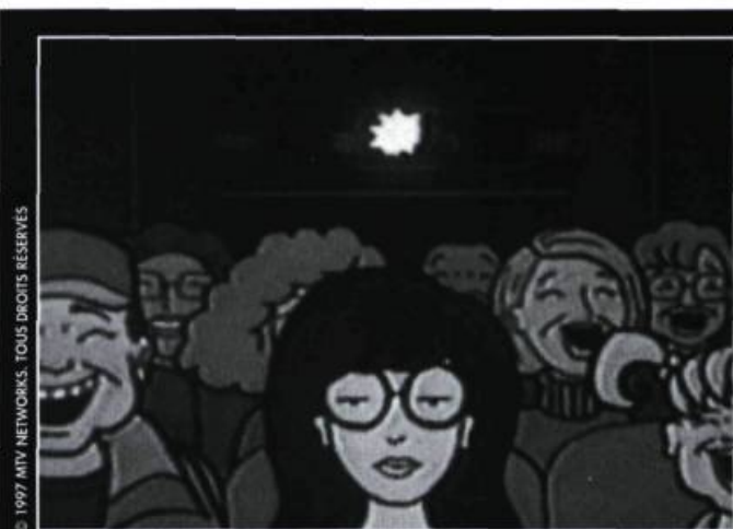
© 1997 MTV NETWORKS. TOUS DROITS RÉSERVÉS

Le corps du toon est en perpétuelle métamorphose, il s'enfle, éclate, s'écrase, se démembrer pour toujours revenir intact, tel le Phénix. S'il est soumis aux lois de la gravité, les conséquences d'une chute s'arrêtent à la fin d'une séquence. La jouissance est double : celle de voir le personnage subir les outrages les plus violents tout en sachant qu'il reviendra intact dans une prochaine séquence afin de subir d'autres turpitudes. Dans South Park , (qui pour moi est un Twin Peaks en cartoon joué par des enfants) le petit Kenny (le plus innocent des quatre bambins) se fait tuer pratiquement à chaque épisode sans que la vie de la communauté n'en soit affectée, à part un invariable cri de son copain Kyle : «Ils ont tué Kenny ! Bande d'enfoirés !», même si Kenny est mort électrocuté ou écrasé par un train. D'ailleurs, qui est cette bande d'enfoirés, sinon les producteurs de l'émission ? Charge contre le tabou qui fait de l'enfant une icône