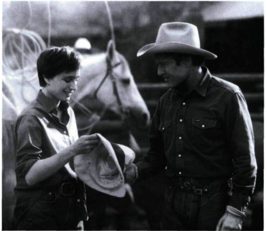
Kristin Scott Thomas et Robert Redford.