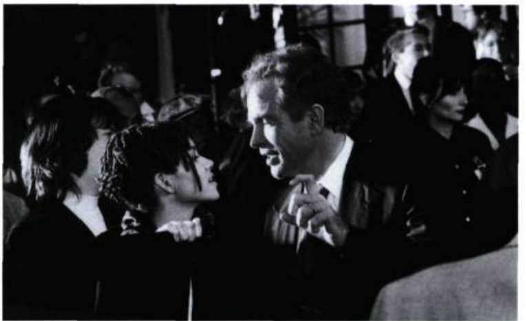
Halle Berry et Warren Beatty.

Le sénateur démocrate J. Billington Bulworth (Beatty lui-même, cabotin) vit un burn-out . Il dit tout ce qui lui passe par la tête, affirmant ainsi à des Noirs qu'ils n'auront pas les programmes sociaux qu'ils réclament parce qu'ils sont trop pauvres pour contribuer à la caisse du parti. Iconoclaste, il plaît à cet électorat, d'autant plus qu'il se distingue des autres politiciens en rappant ses discours. Or, quand il reprend ses esprits et se montre déterminé à transformer la politique, il meurt assassiné par l'un de ses collaborateurs. Morale: le système se paralyse lui-même. Le pessimisme de Beatty, qui en profite par ailleurs pour