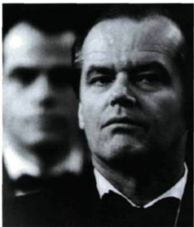
Jack Nicholson dans Prizzi's Honor .

atteindre ce niveau de complexité. Pour John Huston, le génie et la grande maîtrise de l'écriture filmique soutiennent, contrairement à ses émules d'une plus jeune génération, une vision originale d'un détachement et d'une sorte de cynisme narquois devant la mort. Comme dans les rituels mexicains de Under the Volcano , Huston fait sien lyriquement un regard sur la mort qui la transfigure en fête et en joyeuse danse.