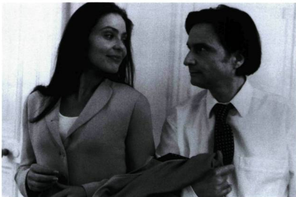
Alice (Ornella Muti) et Nicolas (Jean-Pierre Léaud): de vrais personnages, riches, complexes, attachants.

souffrent, et dont les parcours ouvrent à l'improviste sur des échappées plus troublantes qu'on y aurait songé. Parfait homme au foyer dont le passé cache un secret, Nicolas n'a rien du barbon de comédie. Avocate aux assises (elle y défend un «tueur au pied-de-biche» que le cocuage poussa au crime, écho un peu factice au fil principal),