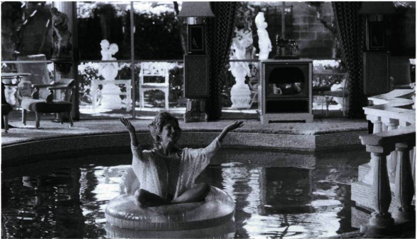
Annette Bening en adepte du Nouvel Âge. Un film ouvertement satirique, ce qui marque une nouveauté chez Burton.

vision genre MusiquePlus, «caninisée» à défaut d'être canonisée, c'est-à-dire que sa tête se retrouvera greffée sur le corps d'un chihuahua, lequel connaîtra le sort inverse (pauvre bête...). Burton n'est pas dupe: il sait bien que son histoire d'extraterrestres est un immense et coûteux train électrique que lui ont offert les studios Warner Brothers et comme il veut être cohérent et ne pas se prendre au sérieux, il s'amuse sans contrainte à en détruire les attraits commerciaux (les vedettes), allant de cette manière à l'encontre des règles régissant des films comme Independence Day où l'élimination des personnages s'effectue en fonction d'un message moralisateur.