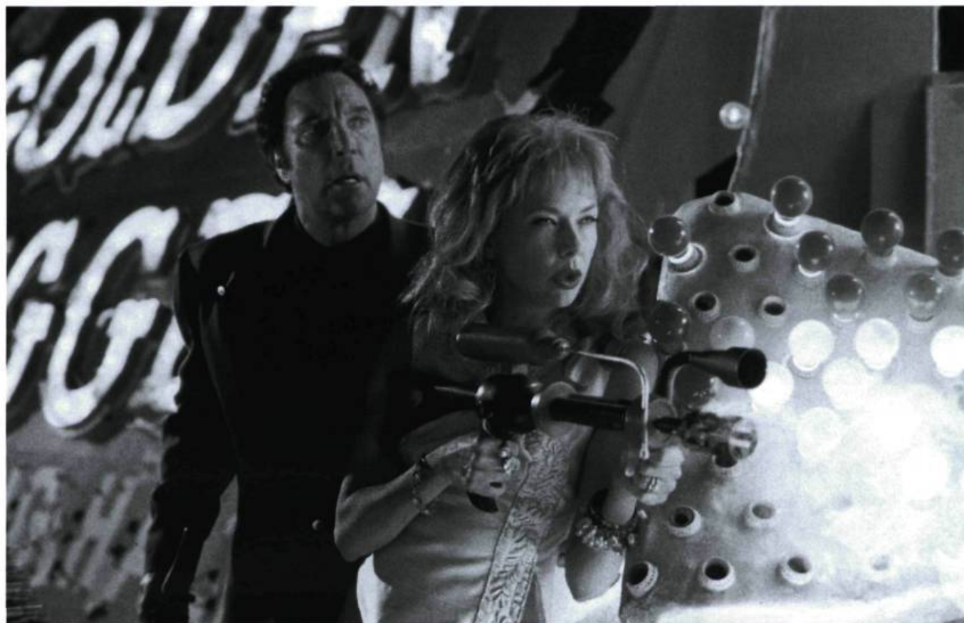
Tom Jones et Annette Bening. Mars Attacks! apparaît comme le double inversé d' Independence Day .

seulement au réalisateur de signer une œuvre dont le statut de mégaproduction ne doit pas cacher la surprenante étrangeté, mais aussi d'aller à contre-courant de ce qui fait sa réputation de visionnaire flyé — cette étiquette qu'on lui a collée trop vite —, se montrant à l'aise dans l'installation de nuances et climats fragiles, comme il l'avait fait d'ailleurs pour Ed Wood , son opus précédent. Or, bien que tous ses films racontent la rencontre de deux mondes, il reste néanmoins que Mars Attacks! peut avoir quelque chose de déconcertant: il serait facile en effet d'y voir un film «drôle mais inégal» compte tenu de l'apparente banalité des segments terrestres. Pourtant, ce réalisme «de l'insignifiance» — un pseudo-classicisme, en quelque sorte — n'est pas du tout le fruit d'une pauvreté d'imagination (comme on a pu le lire ailleurs), il a au contraire comme fonction de donner plus d'efficacité à la satire. En définitive, la drôlerie débridée des Martiens a d'autant plus d'attrait et la satire, d'autant plus d'efficacité que les mœurs terrestres paraissent légèrement ennuyeuses et un peu vides de sens.