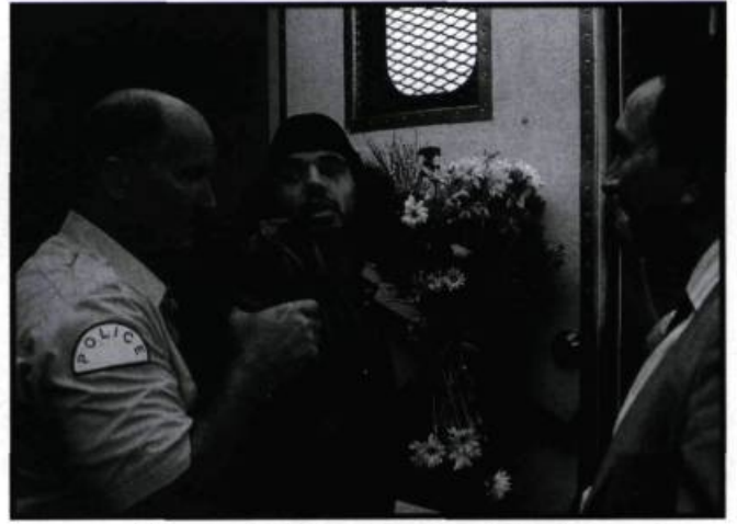
Mohammed pris pour un poseur de bombes.