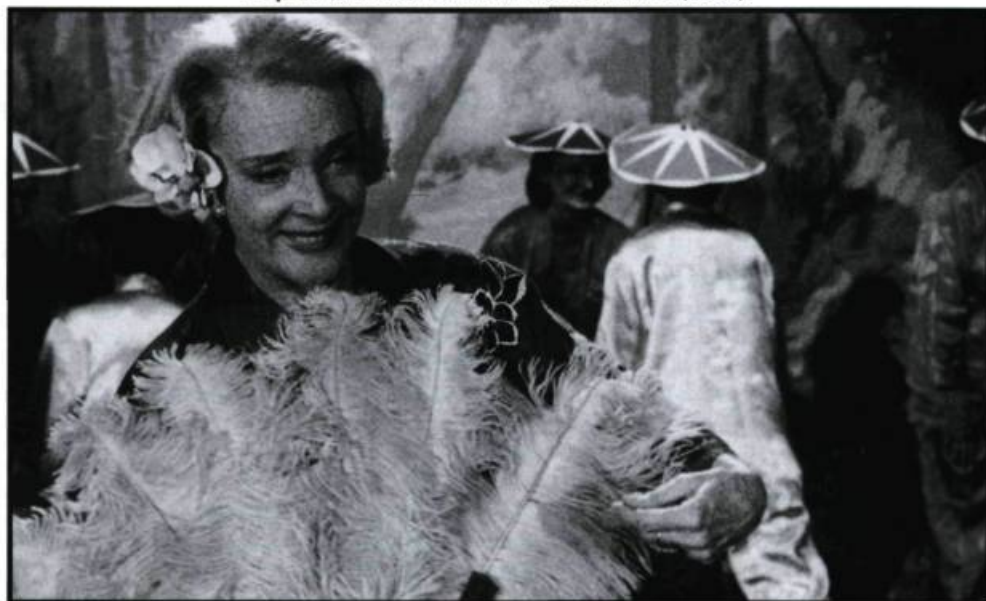
Le jour des rois de Marie-Claude Treilhou (1990).

Pensez-vous que les rôles sont plus variés aujourd'hui qu'à vos débuts? Je me souviens d'un entretien avec