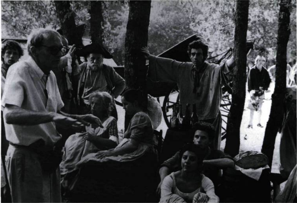
René Allio dirige les comédiens d' Un médecin des lumières tourné pour la télévision (1988).

Mais l'évolution du cinéma ne s'est toutefois pas faite dans le sens d'une remontée vers un registre artistique original. Une revendication de véracité, de naturel, de ressemblance avec la vie fonctionne