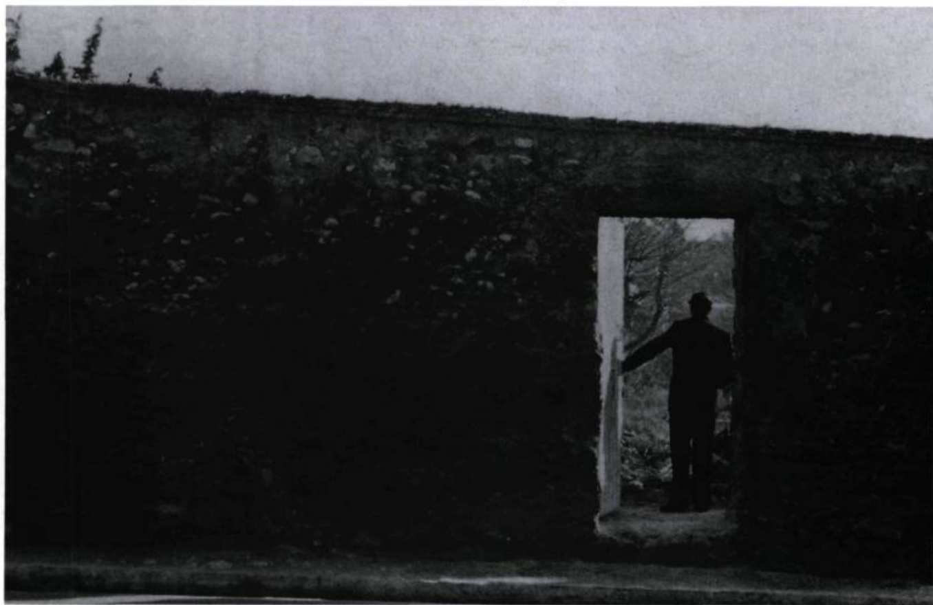
Retour à Marseille (1979).