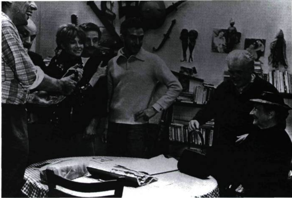
Premier long métrage de René Allio: La vieille dame indigne (1965).

Je venais à Villeurbanne et j'y faisais de longs séjours... Les prises de conscience qui m'ont fait me tourner vers la problématique des autres n'ont pas été lentes, ce qui a été lent, ce qui s'est constitué petit à petit, c'était le besoin de m'engager sur ce terrain avec mon art, de l'investir avec mon art. C'est cette raison qui m'a fait quitter la