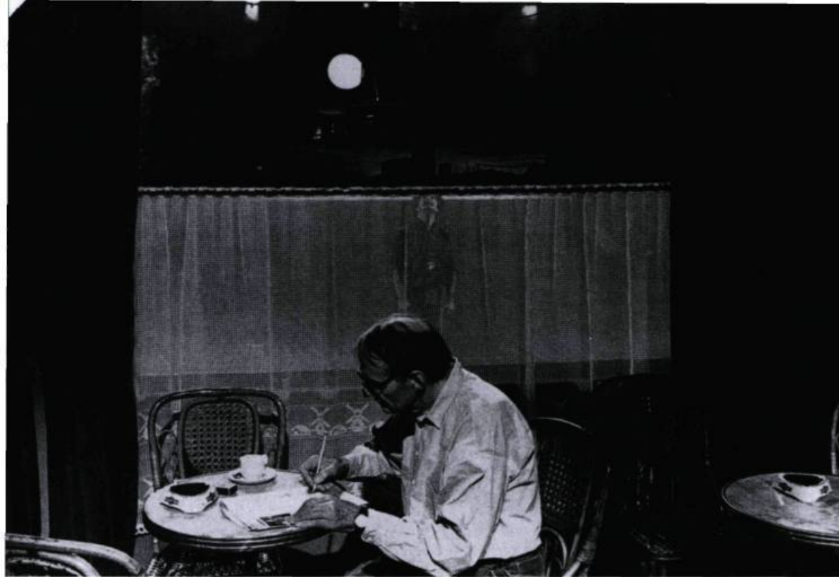
René Allio sur le plateau de Transit (1991).