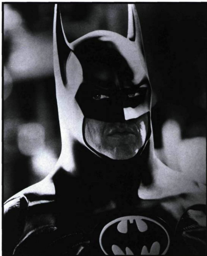
«Montrer la violence pour mieux nous en parler.» Batman de Tim Burton

leçon de la censure que subirent certaines œuvres littéraires (et pas seulement les cas célèbres). Comme celle de la moralité publique dans la littérature du XIX e siècle, la question de la violence à l'écran est de fait inséparable de la question du sens des œuvres incriminées. La censure, qui est affreusement amnésique quant à ses propres impairs, oublie trop souvent que dans le domaine qui est le sien, l'habit ne fait jamais le moine. Isolée, une représentation de la violence ne veut, de nos jours, strictement rien dire : elle est un point sur une ligne qu'il faut savoir tracer si on veut en comprendre toute la portée. Condamner des films comme Batman ou Henry: Portrait of a Serial Killer , c'est littéralement rater le cinéma dans ce qu'il a de plus neuf, de plus novateur. De même, comment M. Claude Benjamin 3 peut-il s'indigner devant des œuvres aussi fortes que Reservoir Dogs ou C'est arrivé près de chez vous , sans dénoncer le tissu de clichés que sont les «soaps» et les rhétoriques perverses qui animent les «reality shows» ?