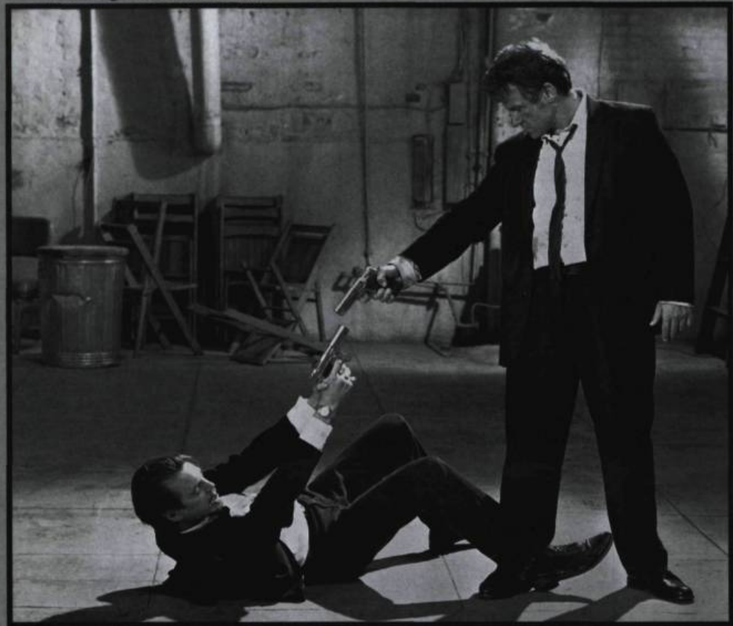
Reservoir Dogs de Quentin Tarantino