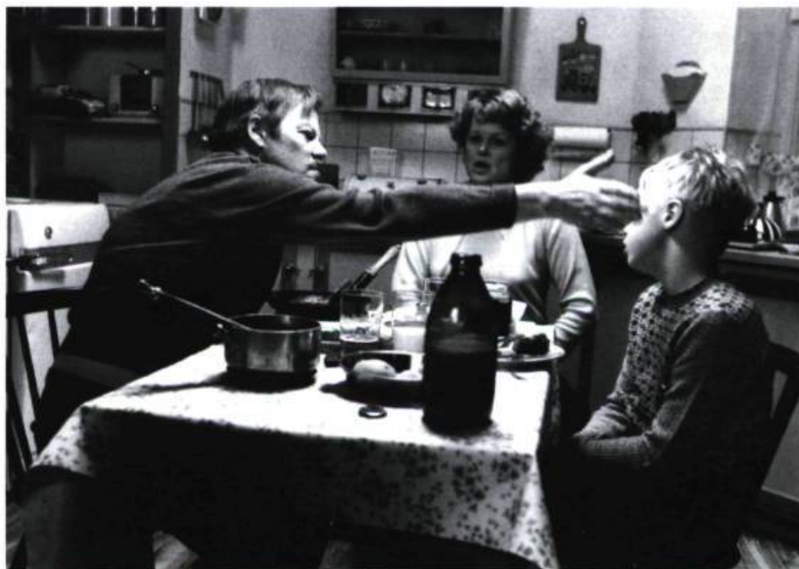
Les petites choses de la vie... ( La valse avec Regitze de Kaspar Rostrup).

Quant au film chinois de la compétition, La Ballade de la rivière jaune de