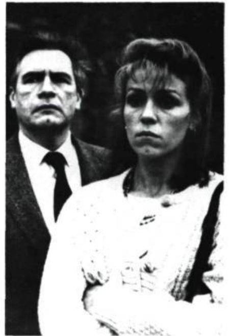
Brian Cox et Frances McDormand