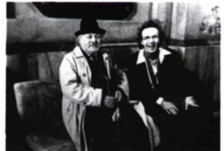
Le préfet Gonnella (Paolo Villaggio) en compagnie d'Ivo