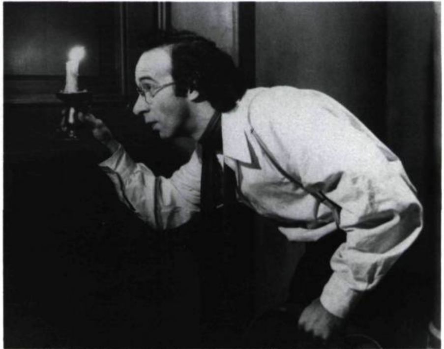
Ivo (Roberto Benigni)

Fellini a encore beaucoup de choses sur le cœur qui l'empêchent de rendre les armes mais il utilise toujours le même marteau pour enfoncer les mêmes clous: la dictature de la télévision et des médias, la création, la poésie, l'imaginaire. Ce moment de la fin où la lune est capturée possédait pourtant le potentiel d'une