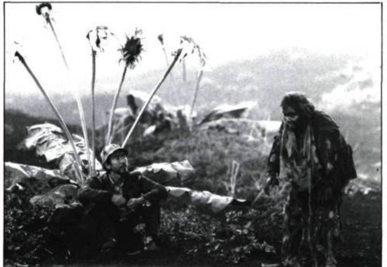
Les démons gémissant