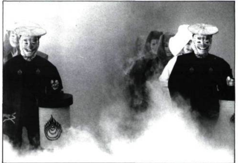
Soleil sous la pluie