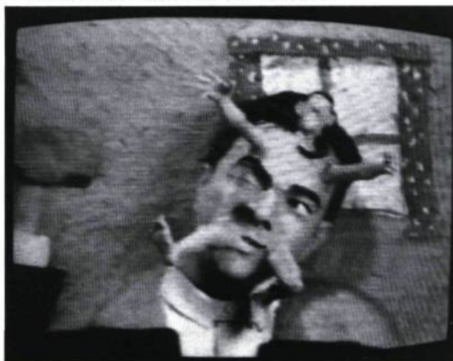
Hommage à Méliès

Sledgehammer de Peter Gabriel réalisé par Steven Johnson