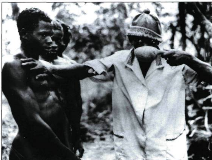
Alter ego: lettres d'un médecin en Afrique de Hillie Molenaar et Joop van Wijk. «Un film sur la coopération nord-sud qui se transforme en film ethnologique.»