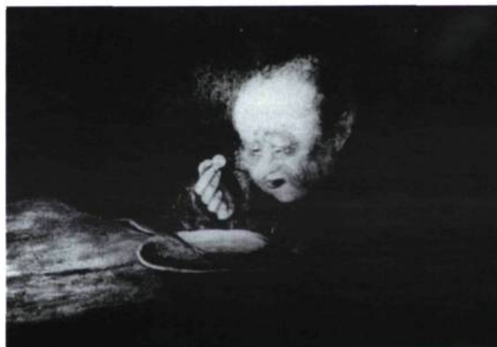
Le manteau, adaptation d'une nouvelle de Gogol.