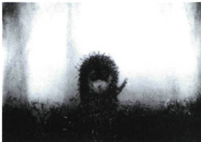
Le bérissou dans le brouillard