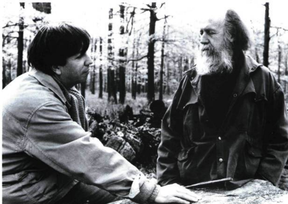
«Lui» en discussion philosophique avec le sage Hubert (Hubert Reeves)