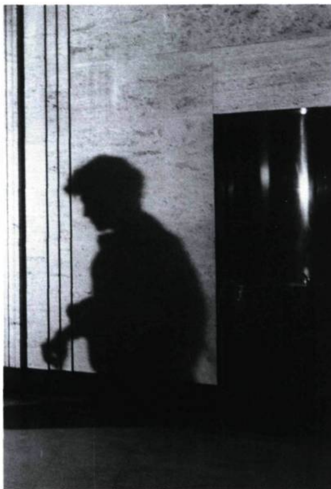
L'ombre de nous de Guylaine Roy. «Un cinéma existentiel.»

frontières. Mais désavoués, tenus en réclusion tant par les institutions que la critique, jamais ils n'ont pu s'imposer comme voie de rechange, comme modèles.