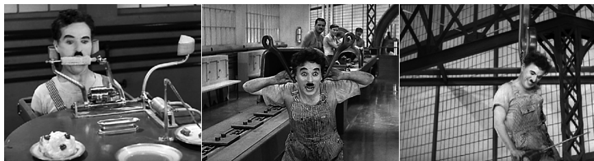
Fig. 2a, 2b, 2c. Charlie Chaplin, Modern Times ( Les temps modernes , 1936).

L'animalisation du travailleur, disséminée en quelques images furtives , récapitule les diverses étapes du sort de la bête d'élevage : son alimentation, sa transhumance en troupeau (ce que l'industrie appelle la « viande sur pattes »), le passage de l'organisme dans la machine et l'apparition dernière du corps suspendu au crochet. Elle traduit certes l'aliénation du travailleur, son devenir-autre, mais en le déclinant à travers une modalité souvent ignorée au profit de