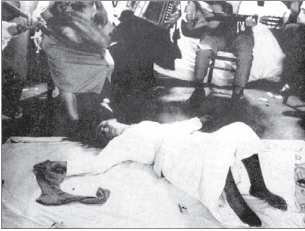
Fig. 1: « (La tarentulée) commence son cycle chorégraphique par la phase au sol, rampant sur le dos autour du périmètre cérémoniel » (De Martino, 1966, Fig. 2).

Le décor connaît certaines constantes. Le périmètre cérémoniel est très souvent agrémenté de feuillage, ainsi que de petites fontaines d'eau. Un drap blanc est étendu par terre pour délimiter la « scène » de la victime, des images de saint Pierre et saint Paul « aux couleurs vives » sont mises à sa disposition (Fig. 1). Dans un effort du christianisme à neutraliser une expression païenne, les figures de ces saints s'étaient incorporées au rituel, imposant ainsi le retour des tarentulés à l'église de Galatina. Ceux-ci y affluaient dans l'espoir de s'y faire accorder la grâce, élément clé de la résolution finale. Le dispositif est donc constitué de cette alliance opérante de sons – d'une importance capitale –, de gestes chorégraphiques adéquats, de couleurs vives, et d'un public. Les musiciens ont ce rôle décisif dans la plupart des cultes de possession, que Luc de Heusch 25 attribue à l'hypnotiseur. Malgré son caractère effacé, la musique agit éminemment sur l'induction de la transe chez les possédés. Les musiciens de la tarentelle sont pour De Martino « médiateurs », « stimulateurs », guides de cette évolution du corps-tarentulé vers le corps-instrument , puis vers le corps-rythmique et mélodique. Cette thérapie ne s'accomplit pas « seulement grâce aux sons et aux couleurs, mais les arômes peuvent aussi jouer leur rôle 26 ».