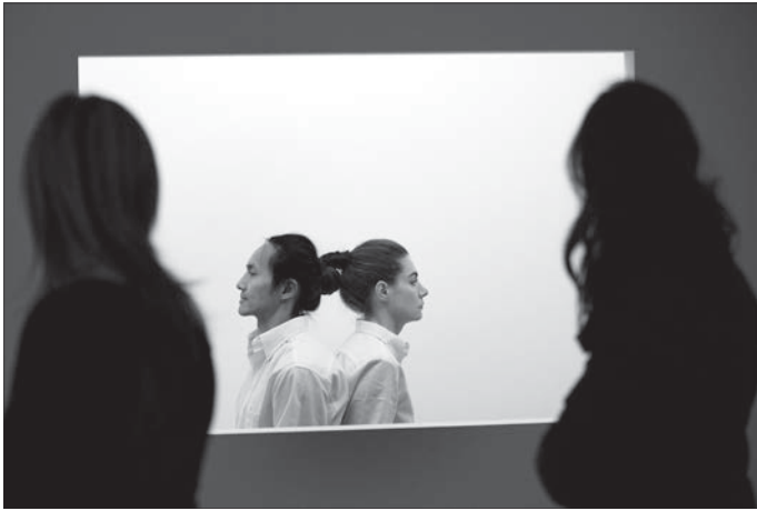
Fig. 2: Marina Abramović, Relation in Time (October 1977), 2010. Performance reproduite par Gary Lai et Rachel Brennecke ( Marina Abramović: The Artist is Present , 14 mars-31 mai 2010).

sixième étage de l'institution new-yorkaise, seules cinq performances 6 étaient recréées parmi les documents photographiques, vidéographiques et filmiques qui constituaient le cœur de l'exposition. Marina Abramović: The Artist Is Present établit une dialectique entre le document et le direct. Les performances qui ont été recréées procèdent toutes de tableaux vivants. Elles sont « exposées » à proximité des documents photographiques et vidéographiques des performances « originales », brouillant la frontière entre le direct et l'enregistré, entre la primauté de l'événement et la secondarité du document. De plus, bien avant l'ouverture de l'exposition, Abramović et les reperformeurs ont réalisé des photographies qui tiennent lieu de concepts pour les « re-performances » et qui sont reproduites dans le catalogue. Enfin, dans l'exposition et dans la publication, l'artiste cherche à donner à ses images documentaires une valeur de script ou de notation.