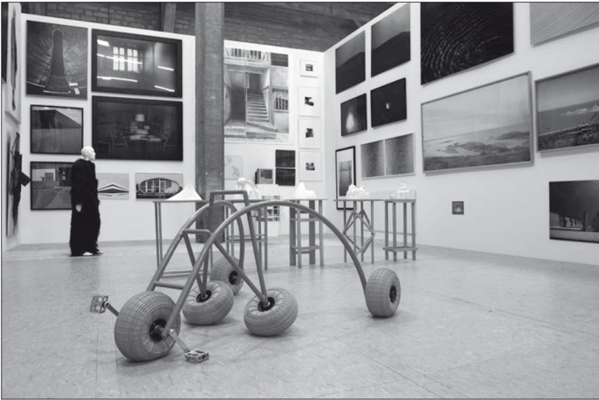
Fig. 5: La Grande Galerie .

... en référence à la Grande Galerie du Louvre ?