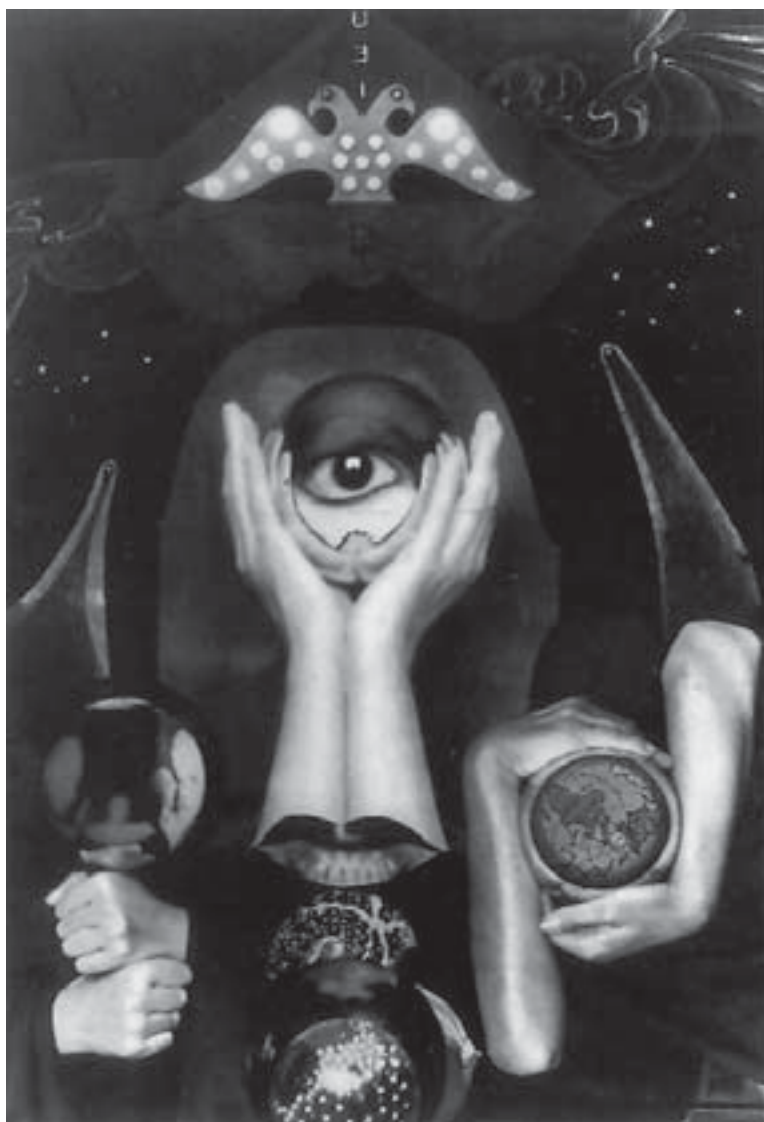
Fig. 4. Claude Cahun, Marcel Moore, Aveux non avenues, Tableau 1 , Photomontage original, 1929-1930, coll. National Gallery of Australia, Canberra.