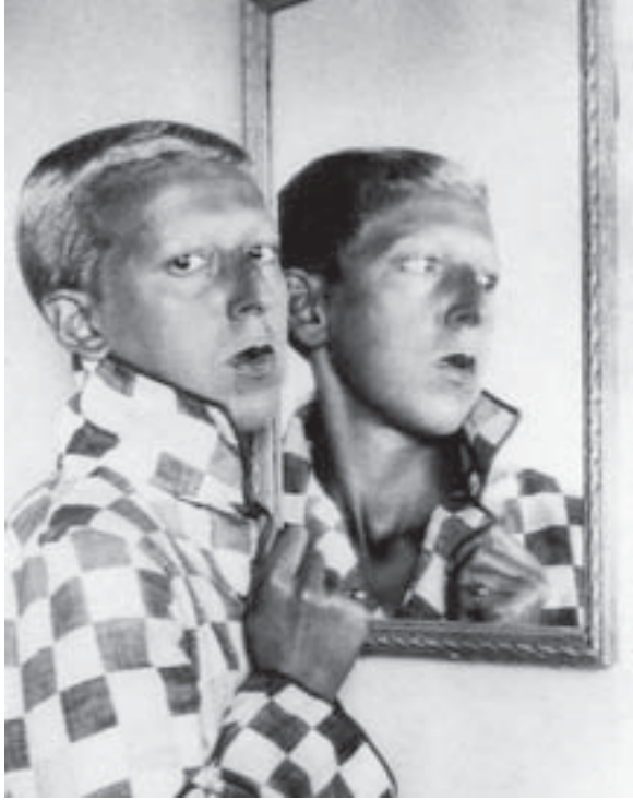
Fig. 1. Claude Cahun, Autoportrait , 1928, coll. Musée des Beaux-Arts, Nantes, coll. privée, Évreux.

complémentarité entre Cahun et Moore, il faut s'attarder sur les détails de leur autoreprésentation qui emprunte le plus souvent la voie de l'autoportrait photographique. L'emblématique « Autoportrait 21 » (fig. 1) de Claude Cahun devant un miroir, aux cheveux courts et au regard tourné vers le spectateur, qui