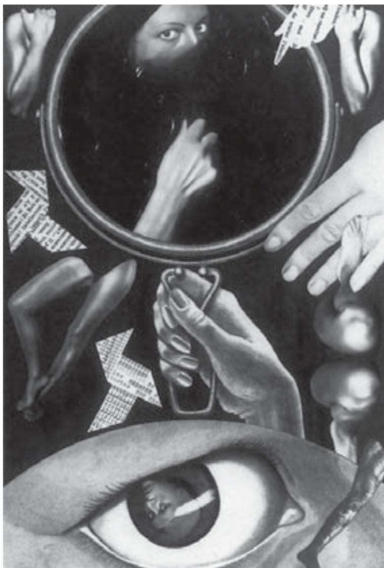
Fig. 8. Claude Cahun, Marcel Moore, Aveux non avenues, Tableau III , Photomontage, 1929-1930, coll. privée (avec l'aimable autorisation de la Galerie Zabriskie, New York).