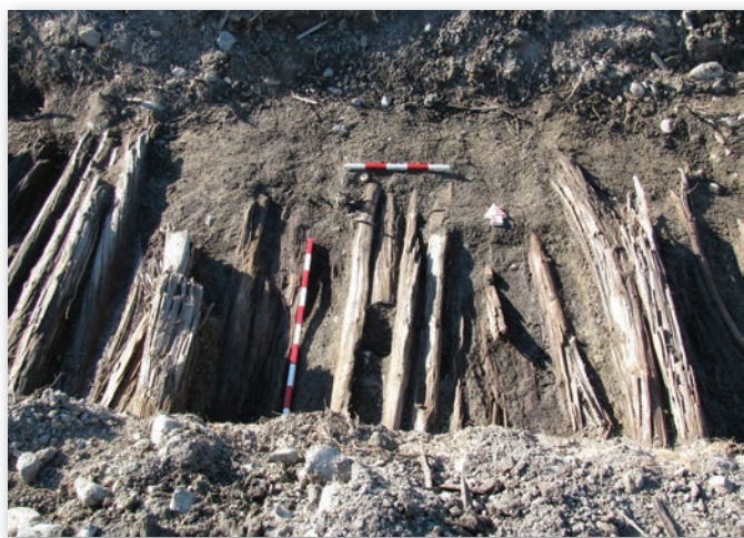
Lambourdes mises au jour dans une section du chemin du Portage de 1783 à Témiscouata-sur-le-Lac, dans le secteur de Cabano.

Historiquement, la région du Témiscouata est souvent associée au chemin du Portage, voie de circulation aménagée par le gouvernement colonial britannique en 1783 afin de relier le fleuve Saint-Laurent au lac Témiscouata, permettant ainsi de rejoindre par voie navigable l'estuaire du fleuve Saint-Jean, au sud du Nouveau-Brunswick actuel, et Halifax. Ce chemin, en fonction partielle ou complète pendant près de 80 ans, n'est en réalité que le plus connu d'un grand nombre de voies de circulation qui ont marqué le développement régional et national. En 2002, une étude historique produite pour le compte du ministère des Transports du Québec, dans le cadre du projet de construction de l'autoroute 85, a notamment démontré que l'emprise projetée devait croiser ou réemprunter en partie le tracé de plusieurs de ces anciennes voies 1 . Parmi celles-ci, mentionnons notamment des chemins de portage autochtones longeant la rivière des Roches, le chemin du Portage de 1783, le Vieux Chemin de 1839-1840, et le chemin Neuf de 1856-1862. Cette étude a aussi mis en évidence le peu d'informations disponibles sur le chemin ou sentier que les autorités françaises avaient aménagé en 1746, qui a précédé le chemin du Portage de 1783 et auquel un plan de John Collins de 1766 réfère sous le nom de Temiscouata Portage .