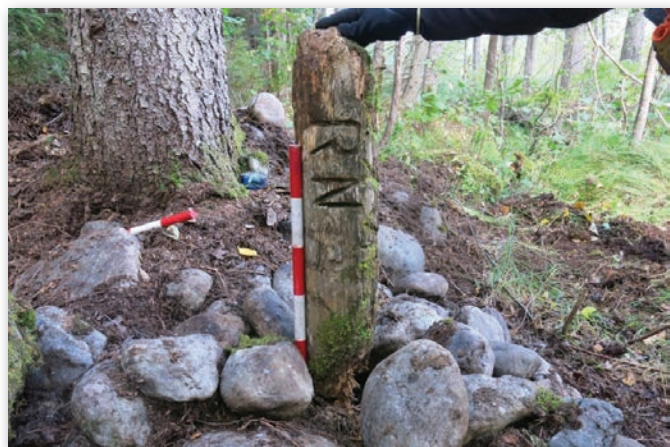
Borne cadastrale portant l'inscription RN, signifiant « Rang Nord ».

provinces maritimes actuelles se croisent à l'esker, ce qui comprend le chemin de fer du Témiscouata et la ligne de télégraphe, tous deux aménagés à la fin du XIX e siècle.