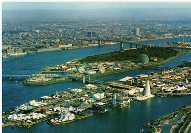
Expo 67. Vue aérienne du site et des pavillons. – 1967.