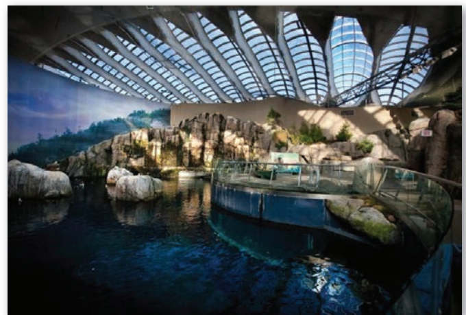
Biodôme de Montréal.

Cette histoire des institutions culturelles à travers les témoignages apporte un autre regard qui dépasse les discours officiels. On passe de la mémoire individuelle des muséologues à une histoire de la modernisation de la muséologie au Québec.