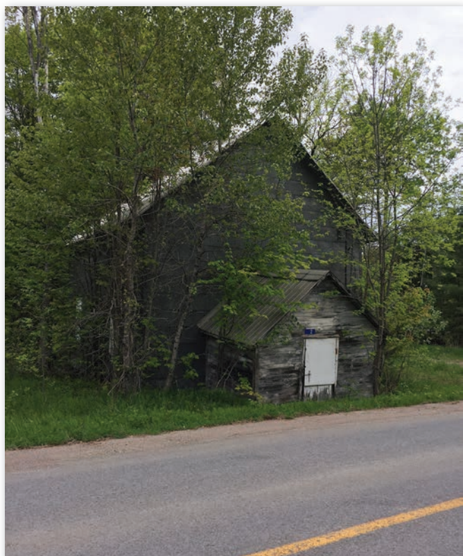
Loyal Orange Lodge N° 46, Bristol, collection personnelle, Wes Darou, juin 2018.

Située au 17, chemin Shouldice, à La Pêche, cette loge est décrite dans une masse de documents du fonds D' Stuart Geggie, au Centre régional d'archives de l'Outaouais 26 . Cette bâtisse servait aussi d'école, donc il y a deux portes, une était pour les filles et l'autre pour les garçons. Aujourd'hui, elle aussi est une résidence.