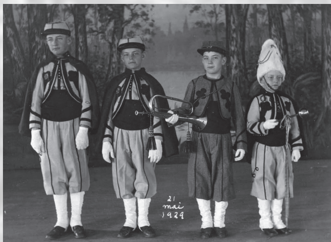
Petits zouaves.