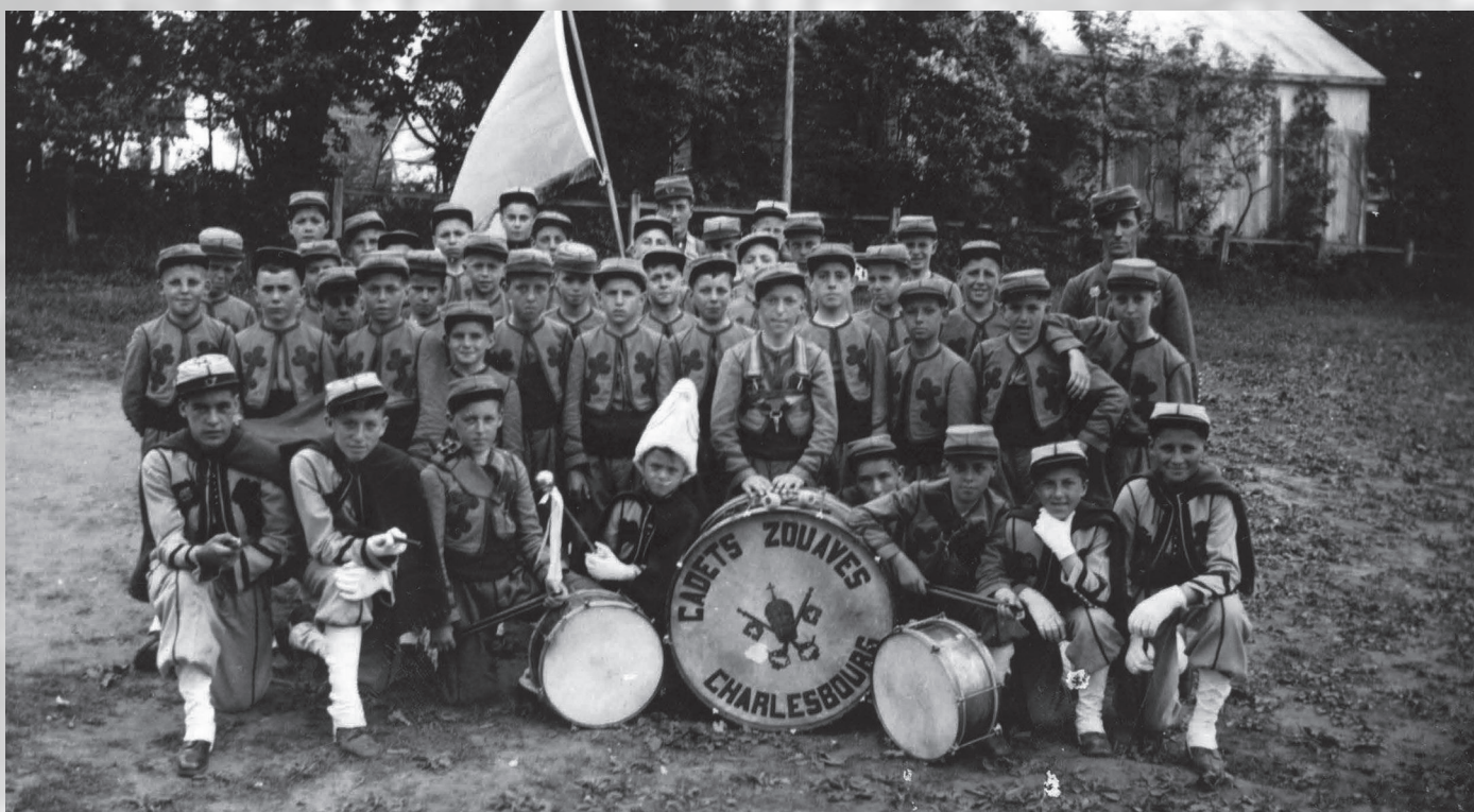
Petits zouaves.